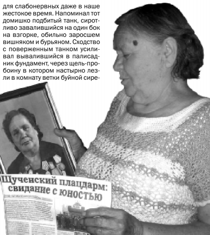
Щученский плацдарм: свидание с юностью

Никитична не столько за себя, а за них, ушедших, и до сих пор считает себя часовым плацдарма своей фронтовой юности. Настырностью своей добились учреждения общерайонного праздника: 14 января - День освобождения лискинского правобережья от фашистских захватчиков.