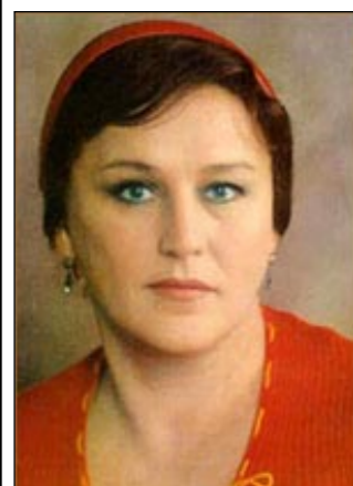
По материалам vesti.ru, dni.ru, newsru.com, lenta.ru.

Нонна Мордочкова все еще находится в большой палате отделения неврологии Центральной клинической больницы.