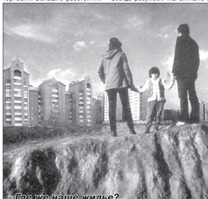
Где же наше жилье?..

Нехватка лекарств для обеспечения льготных рецептов вызывает шквал звонков в редакции телеканалов и газет, а потому журналисты не упустили возможности получить комментарий из первых уст. По словам губернатора, из заявленных на первый квартал необходимых лекарств на сумму 192 миллиона рублей Министерством здравоохранения утверждено на сегодняшний день только 119 миллионов. Исходя из этого - и поставки.