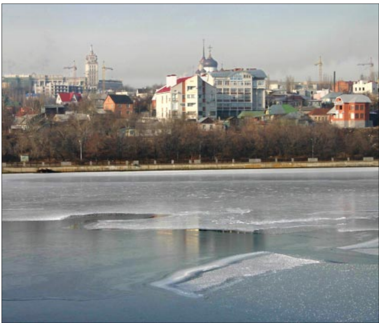
На водохранилище «приходит» лед.