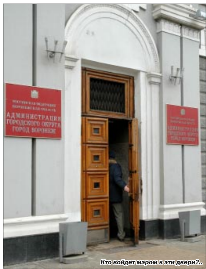
Кто войдет мэром в эти двери?

Конечно же, надо хорошенько подумать, прежде чем опустить бюллетень в избирательную урну.