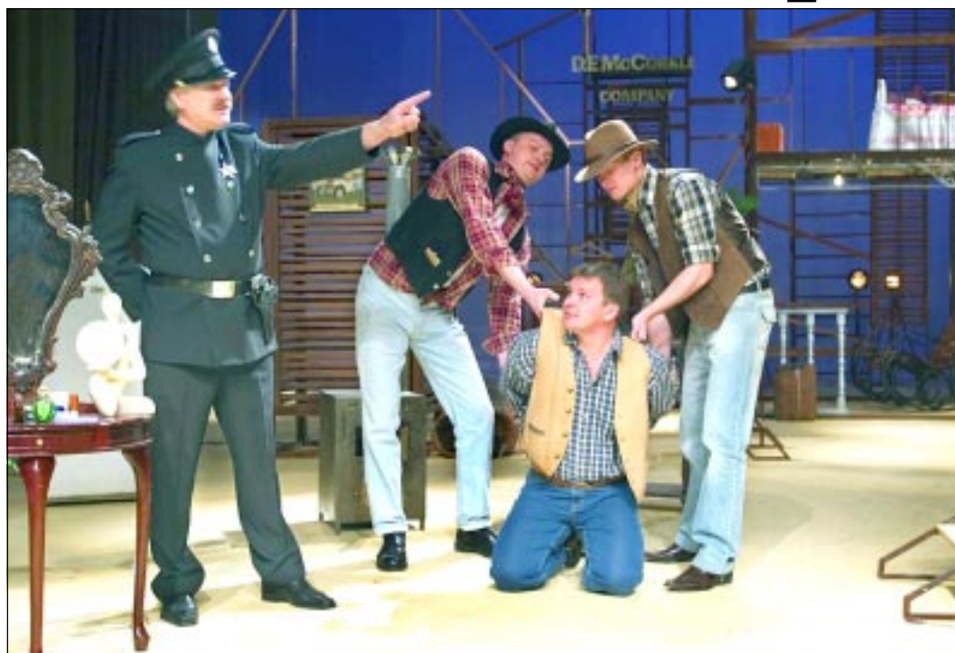
■ Сцена из спектакля «Куклолка».

Персонажи спектакля в постановке народного артиста России, лауреата Государственной премии Анатолия Иванова сложнопонравятся в том, что они творят на сцене нечто «грязное». Да и вообще, можно ли поверить, что эти люди – диковатые американские плантаторы, всю жизнь ухаживая за сбор и обработку хлопка, привычные решать жизненные проблемы с помощью колты или удара в морду? В сущности, Baby Doll Иванова – это вариация в стиле «кантри» на темы пушкинского «Графа Нулина»: вроде и стреляют на сцене, и кричат, и пощёчинами обмени-