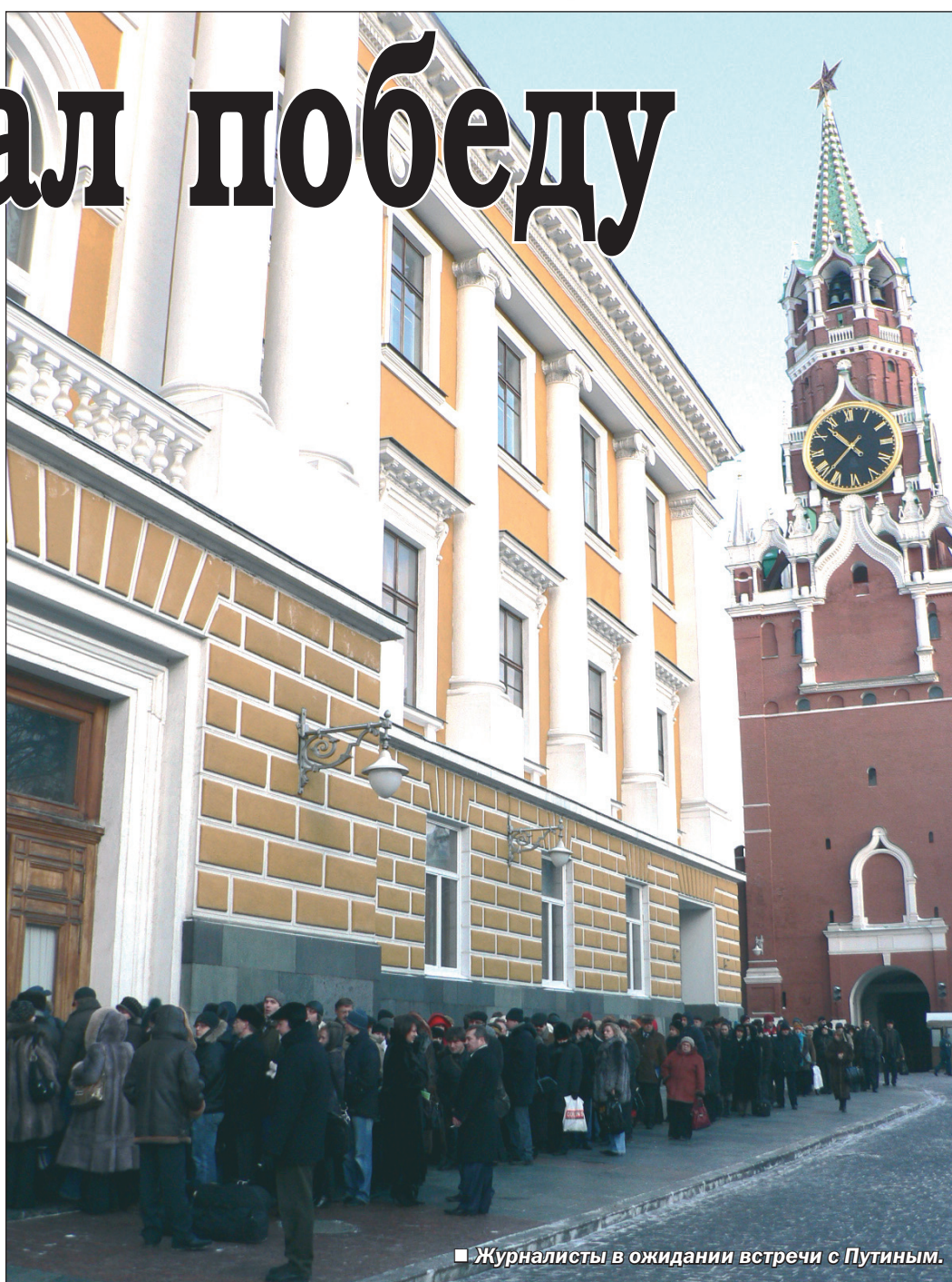
Журналисты в ожидании встречи с Путиным.

Впечатления корреспондента «Коммуны» и ответы Президента России на некоторые вопросы читайте в следующем номере.