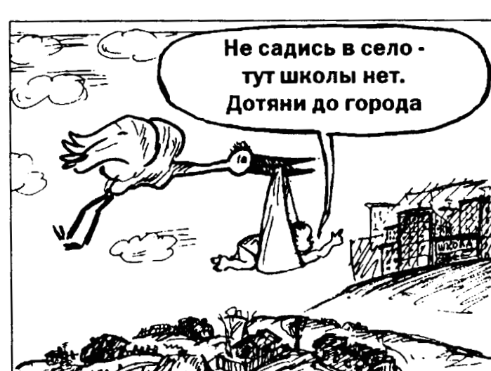
воронежских сельских районов. Вернее сказать, многие главы кантемировских поселений и руководители тамошних хозяйств сходятся во мнении: село имеет перспективы, является привлекательным для переселенцев (трудовой резерв!), если его социальная база предполагает обязательное наличие школы. Точнее, эта база должна рассматриваться в следующей (и никакой иной!) последовательности: школа, медпункт, магазин и почта. Главы поселений знают, что закрыть школы без решения схода граждан нельзя, но «наверху» начали хитрить: вместо средних школ стали делать начальные, а потом и их закрывать.

По Воронежской области, расположенной в самой центральной части России, есть такая статистика: в 2006 году из-за плохого состояния дорог произошло 746 ДТП, в них погибли и ранены 1017 человек! И факт, что трясина на сплошных колдобинах малолетние ребяташки, и