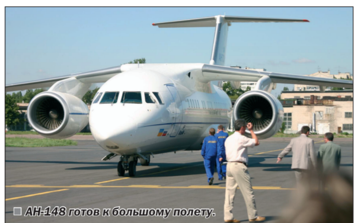
АН-148 готов к большому полету.

В отношении развития села губернатор назвал три основных инвестиционных проекта. А