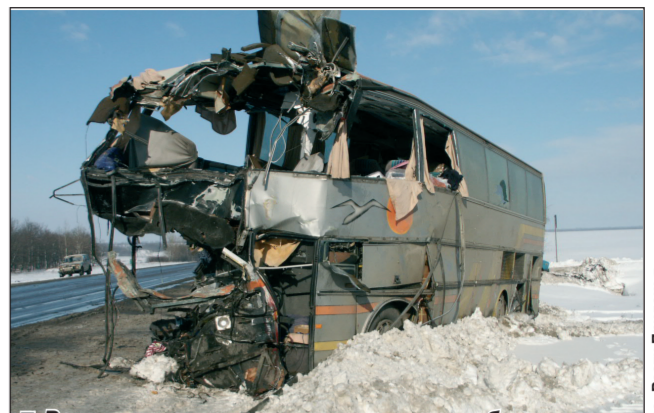
Вот что осталось от двухэтажного автобуса.

Пять человек погибли в результате столкновения рейсового автобуса с грузовиком. Как сообщили «Коммуне» в пресс-службе областного управления ГО и ЧС, авария произошла 7 февраля в 3 часа ночи на 656-м километре федеральной трассы «Дон» недалеко от поселка Лосево Павловского района.