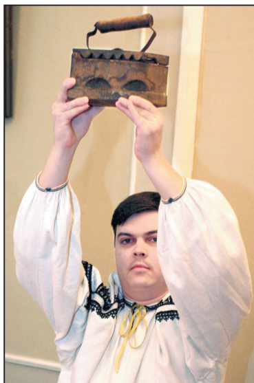
■ Кому утюг?..