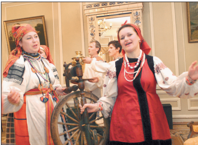
■ Кому прялку?..

ПО ВЕРТИКАЛИ: 1. Кардинал. 2. Ягода. 3. Будка. 4. «Весна». 5. Полюс. 6. Партизан. 9. Филби. 13. Бородин. 14. «Колобок». 15. Капитан. 16. Строчок. 21. Телеграф. 22. Кабестан. 24. Ильин. 28. Шабаш. 29. Экран. 30. Ангел. 31. Терек.