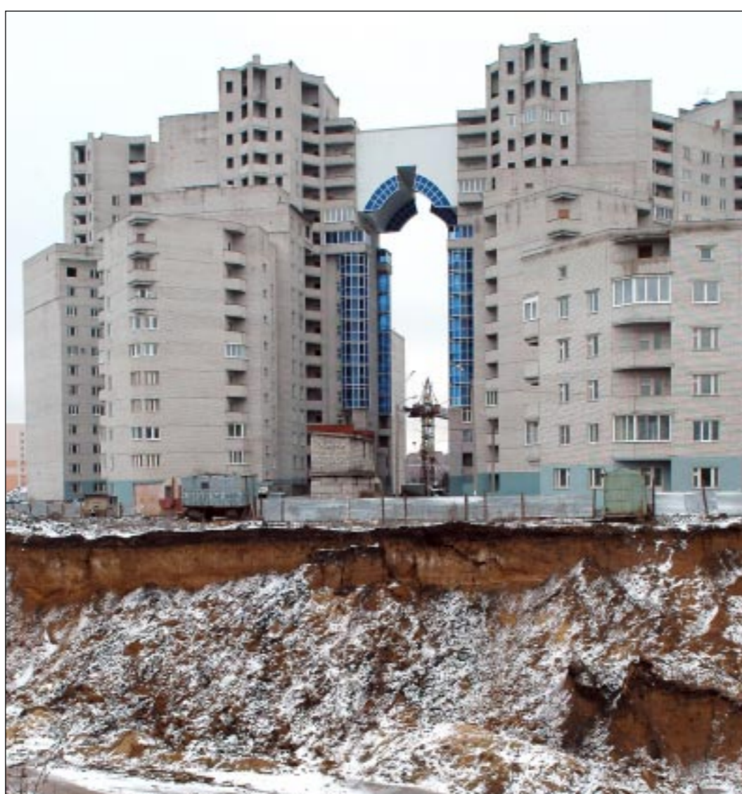
Новый жилой комплекс «Арка» расположен на пересечении Московского проспекта и бульвара Победы. Его строительство по проекту Заслуженного архитектора РФ Станислава Гилёва ведет ЗАО «Воронеж-Дом». «Арка» - это микрорайон со своей жизнью: более 1200 квартир, торгово-офисные центры, подземные гаражи и автостоянки. На сегодняшний день строительные новоселов обрели уже 18 секций. К концу года планируется сдать под ключ еще 600 квартир.

Обручальное кольцо может достаточно серьезно влиять на наше здоровье, говорят ученые. Дело в том, что со временем драгоценный металл начинает окисляться и выделять продукты химической реакции. А эти продукты оказывают влияние на мужские половые железы и могут даже приводить к расстройствам в сексуальной сфере, пишет газета «Труд». Что интересно, на здоровье женщин золото отрицательного влияния не оказывает. Ученые объясняют это тем, что гормональная и половая системы женского организма лучше защищены от внешних воздействий, а потому окисляющийся металл им не вредит. Есть и другой механизм влияния обручального кольца на здоровье. Известно, что в пальцах сосредоточено большое количество нервных окончаний. Естественно, что, надевая кольцо, мы физически воздействуем на передачу нервных импульсов и так или иначе влияем на свое состояние. В этом плане опасно носить тесные кольца. На кисти руки более 400 активных точек, которые связаны с почками, печенью и сердцем. На практике врачи иногда сталкиваются со случаями, когда достаточно снять обручальное кольцо с пальца, чтобы человек навсегда расстался с головной болью и бессонницей (tz.ru).