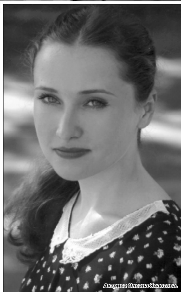
Актриса Оксана Золотова.