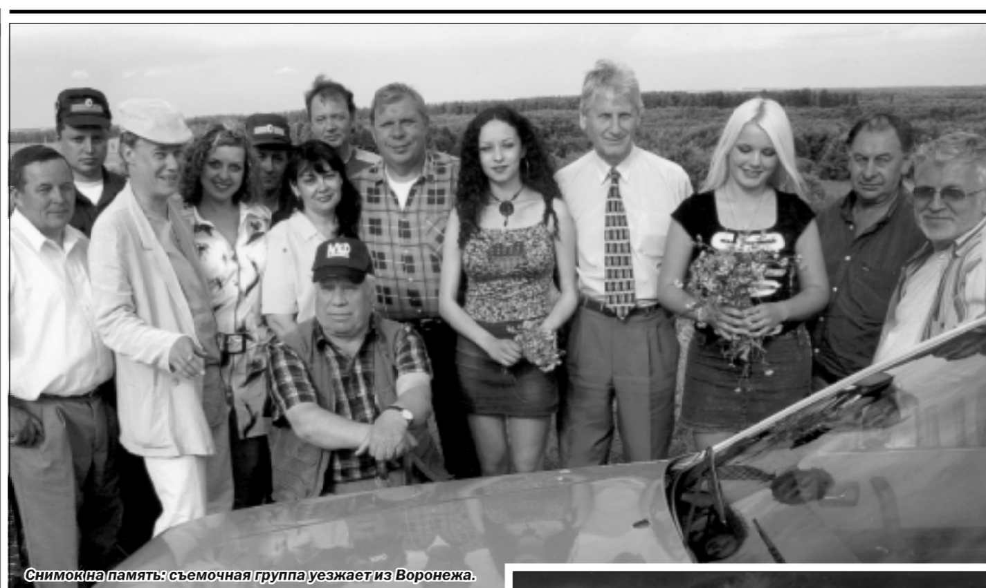
Снимок на память: съёмочная группа уезжает из Воронежа.