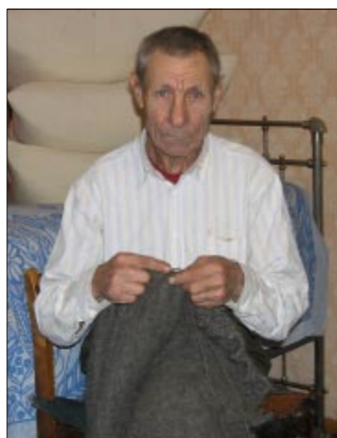
Вот тогда-то, после возвращения из армии, и взял он первый раз в руки вязальные спицы. Случилось так: поехали они однажды с женой в город, к ее подругам, а те — понятное дело — вяжут сидят. «Ну-ка, покажите-ка, как вы это делаете», — вrophe бы в шутку попросил недавний боец. Те показали. Он попробовал — получился!