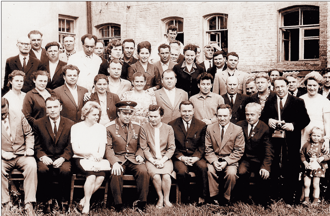
ФОТО ИЗ СЕМЕЙНОГО АЛЬБОМА