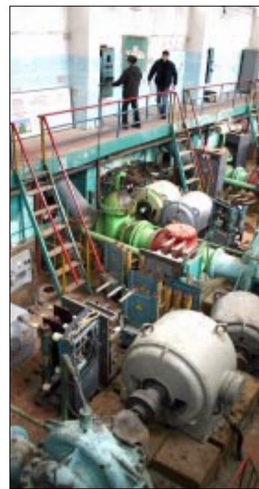
Мощность этой насосной станции - 300 тысяч кубометров «дождя» в сутки.