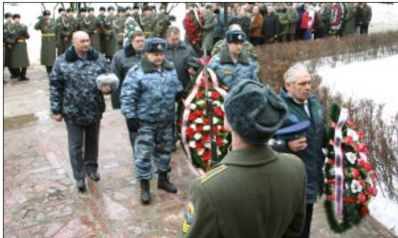
■ Вчера на стадионе «Динамо» состоялось возложение венков к памятному знаку в честь погибших в Афганистане и других «горячих точках».

День вывода советских войск с территории Афганистана еще будет днём, который тревожит наши сердца.