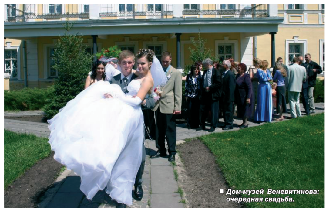
Дом-музей Венеитинова: очередная свадьба.

Дмитрий ДЕНИСЕНКО.