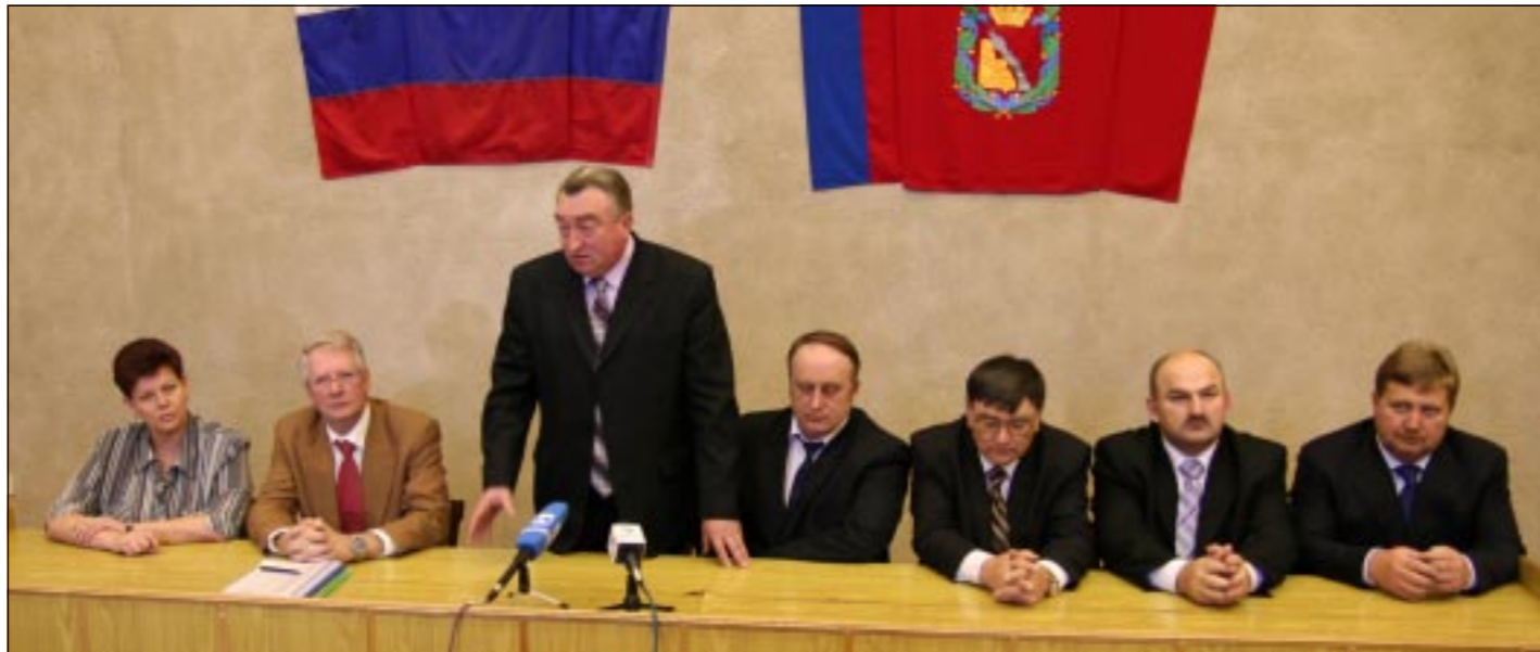
■ Подписание договора с Бутурлиновским районом.

Так что же предлагается разместить на территории Бутурлиновского района? Полностью автоматизированный животноводческий комплекс будет рассчитан на 1200 голов дойного стада. Всего же вместе с телками разных возрастов там будет содержаться примерно 2200-2500 голов крупного рогатого скота. Естественно, от инвесторов потребуются вложение в этот проект немалые средства. Дело в том, что площадка, на которой в начале марта развернется строительство, на сегодня лишена вообще какой бы то ни было инфраструктуры — все придется строить заново. Здесь так же нет и нормального скота, за счет которого можно достичь тех