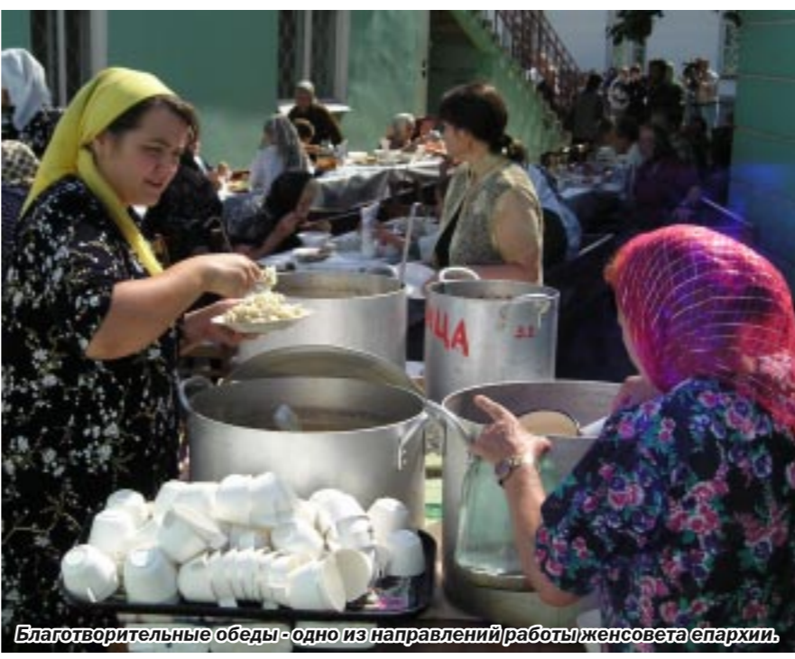
Благотворительные обеды - одно из направлений работы женсовета епархии.

Я полагаю, что съезд должен раскрыть перспективы на будущее в плане социального служения. Мы, матушки, объединились между собой, прежде всего, с целью не чувствовать себя оторванными от жизни. Наше место, как и любой женщины, не только на кухне... Но чтобы объединиться, надо выбрать, вокруг чего объединяться, – мы выбрали социальное служение. Для нас как для христианок ближе всего служение людям, тем более что такое служение всегда было при церкви. Богателены, детские приюты, приходские школы всегда находились при церкви. Священник с матушкой всегда были одними из самых уважаемых людей. И то дело, вокруг которого мы объединились, оно в душе у каждой, оно близко, оно дорого нам. Молитва без дел мертва – и поэтому нас знают практически во всех социальных учреждениях области, мы помогаем интернатам, домам ребенка, центрам реабилитации, тюрьмам. Обязательные благотворительные акции проводим на Рождество, День православной матушки, День защиты детей, День пожилых людей, День милосердия и благотворительности, День знаний. Благодаря инициативе Любови Шевляковой,