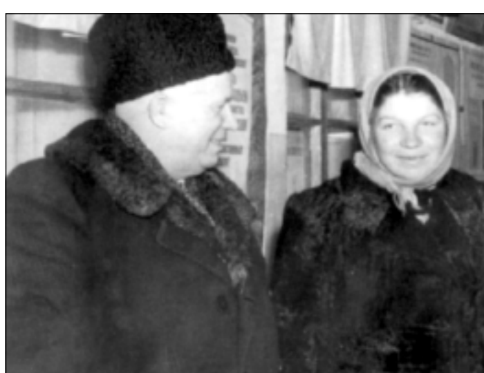
Н.С.Хрущев в Семилукском районе (фото из архива «Коммуны»).