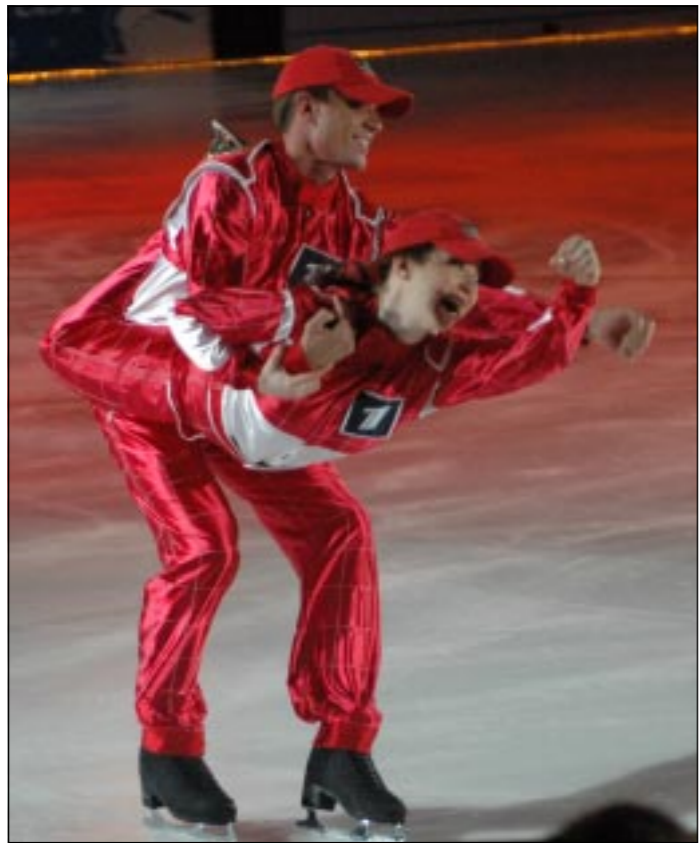
Всегда спортивные Анна Большова и Роман Костомаров.