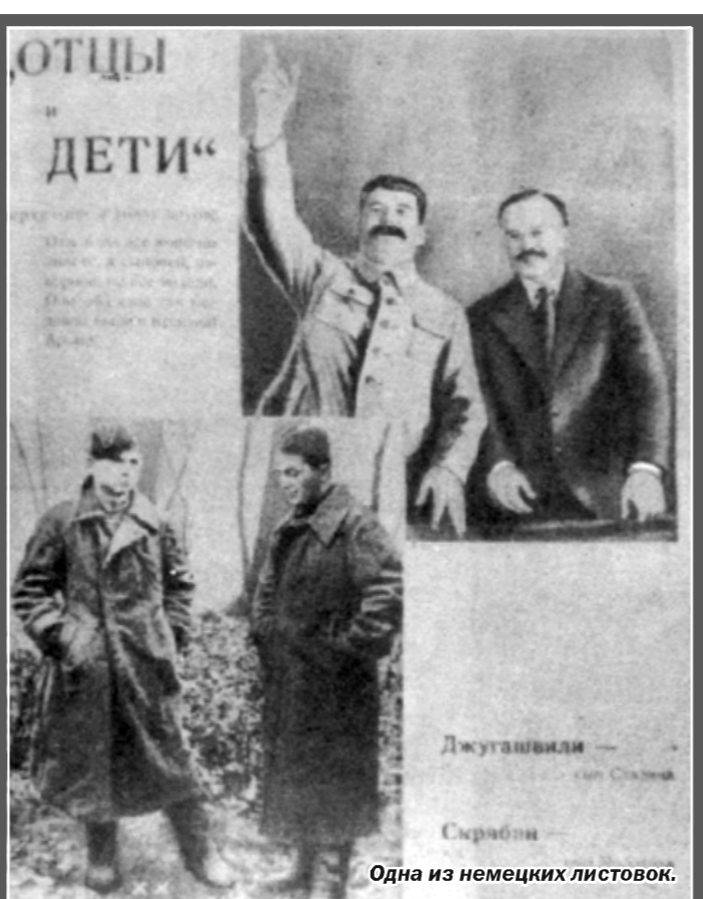
Одна из немецких листовок.