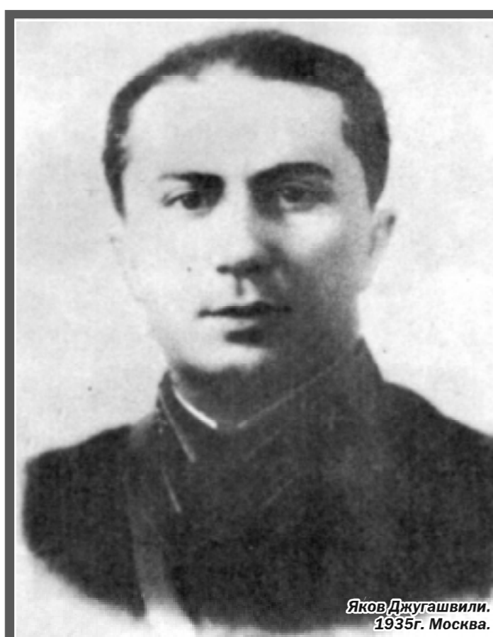
Яков Джугашвили. 1935г. Москва.