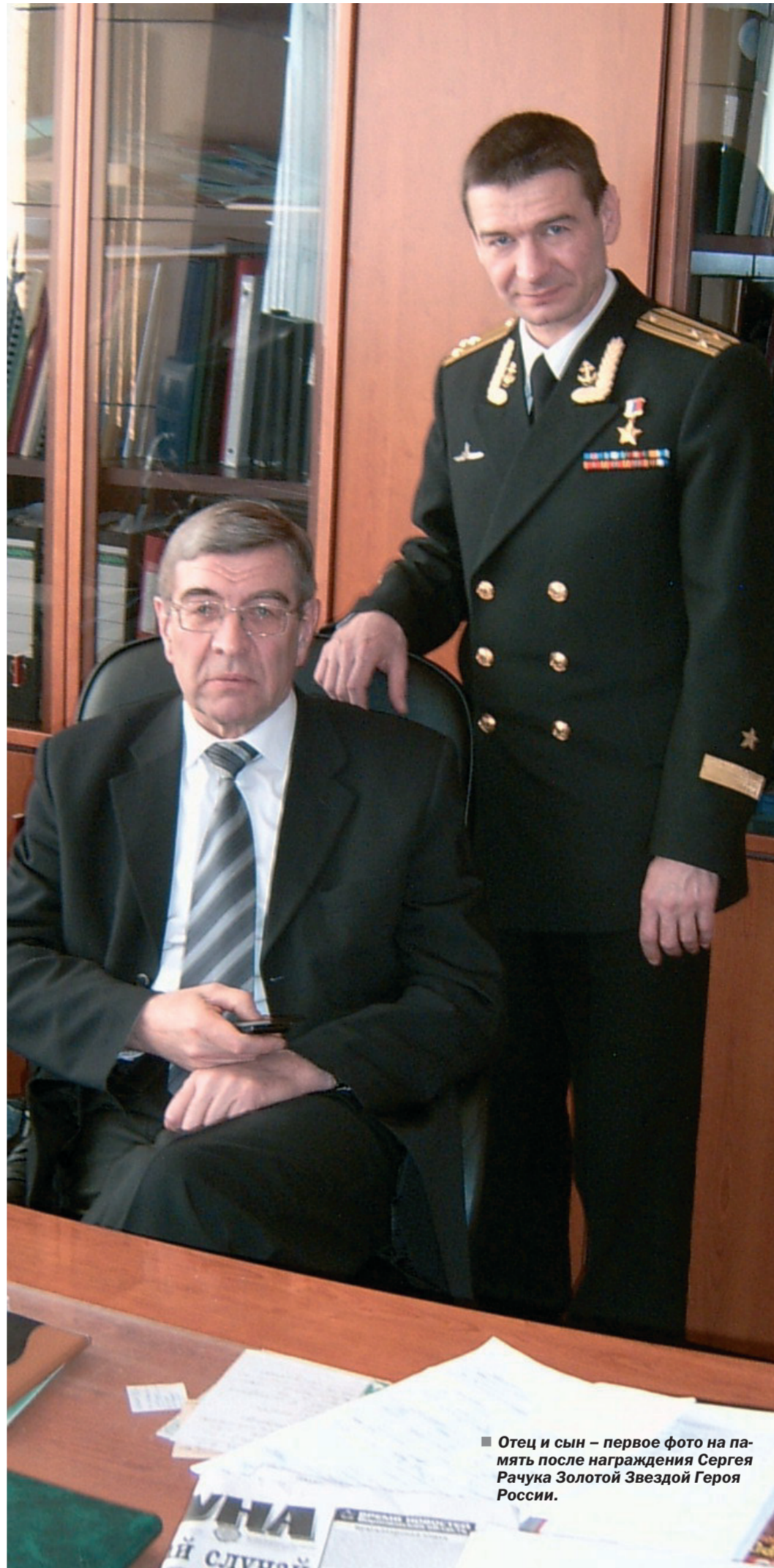
Отец и сын — первое фото на память после награждения Сергея Рачука Золотой Звездой Героя России.