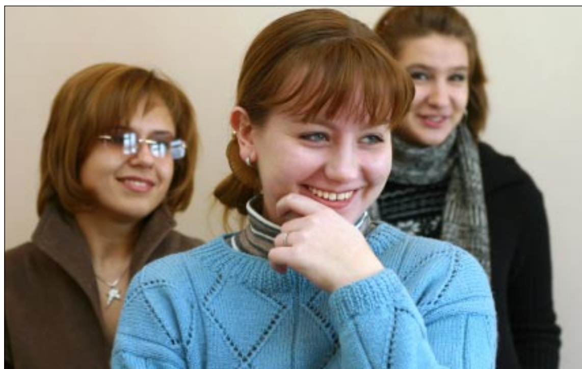
■ Они учатся в академии искусств.