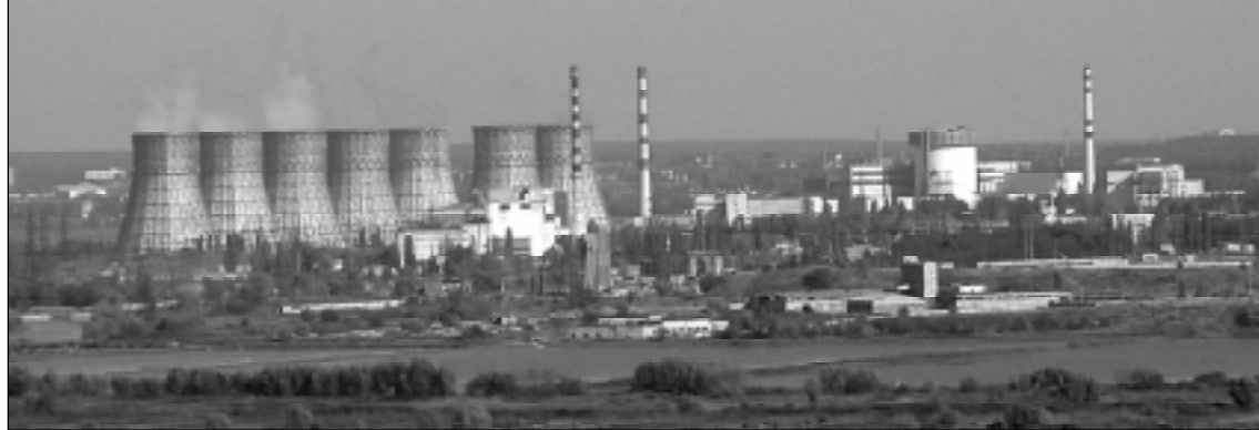
Новые энергоблоки Нововоронежской АЭС должны стать катализатором для экономики области.