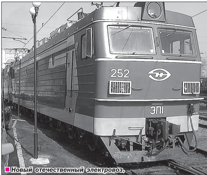
■ Новый отечественный электровоз.

Сообщения подготовили: Юлия САВЕЛЬЕВА, Петр ЧАЛЫЙ, Ирина ШАБАНОВА.