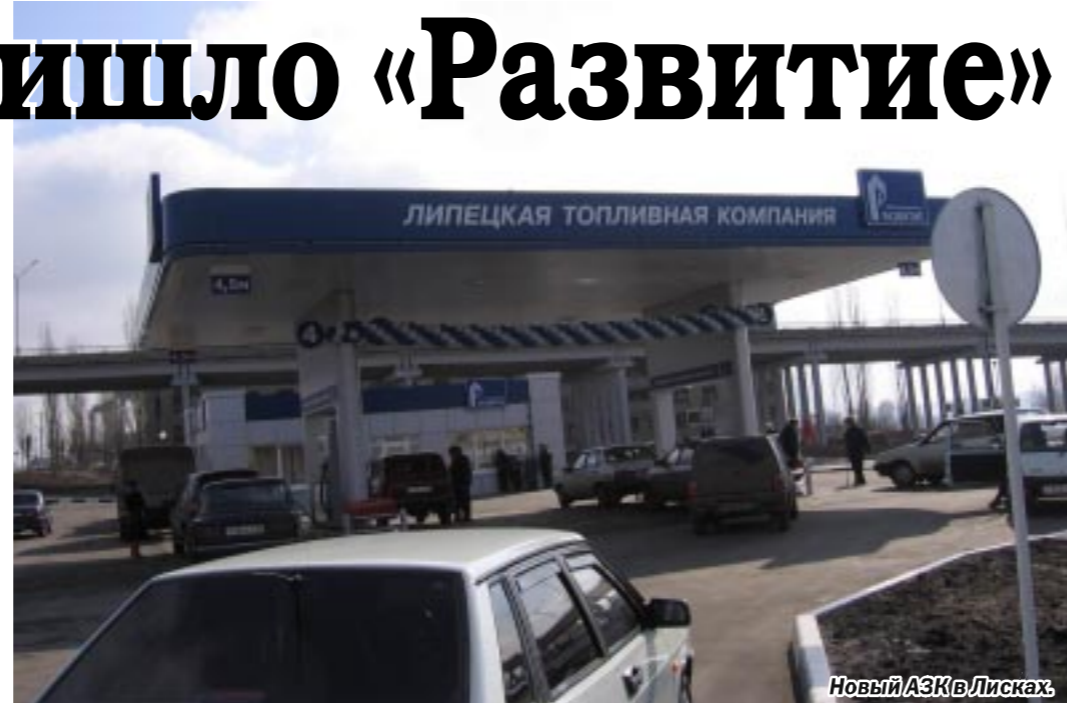
Новый АЗК в Лисках

Сдача АЗК в Лисках укладывается в план стратегического развития розничной сети АЗК и АЗС в Воронежской области. Их намечается иметь не менее 25. АЗК в Лисках под номером 54 — пятый объект в Воронежской области. На очереди строительство и сдача АЗС в Бутурлиновке, Богучаре, Россоши и других районах.