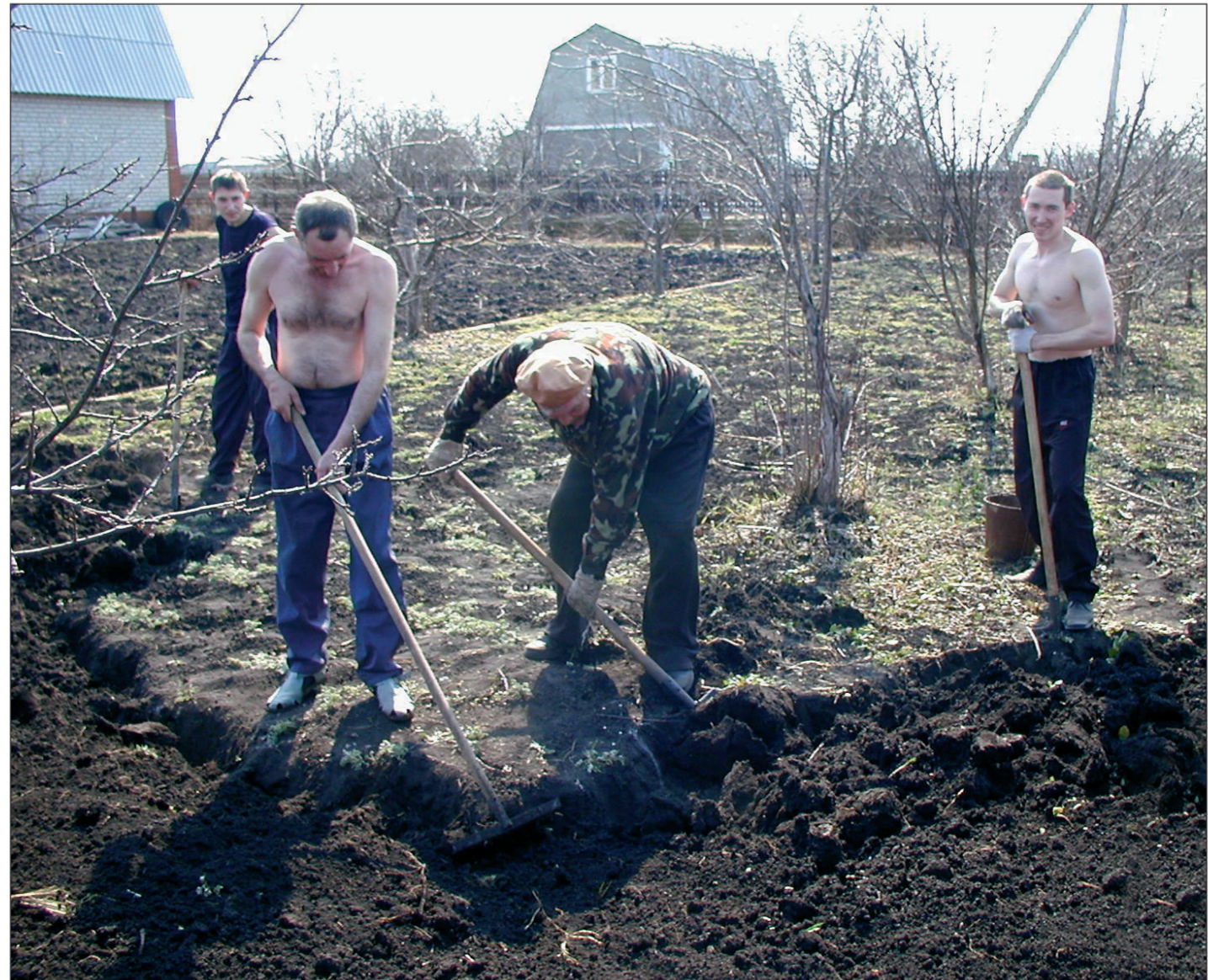
■ Необычайно ранняя весна позвала на огородные работы обладателей «фазенд». Этот снимок в минувшие выходные дни фотокорреспондент Михаил Вязовой сделал в садово-огородном кооперативе «Усманка-2».