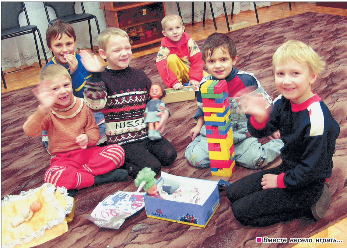
Вместе весело играть...