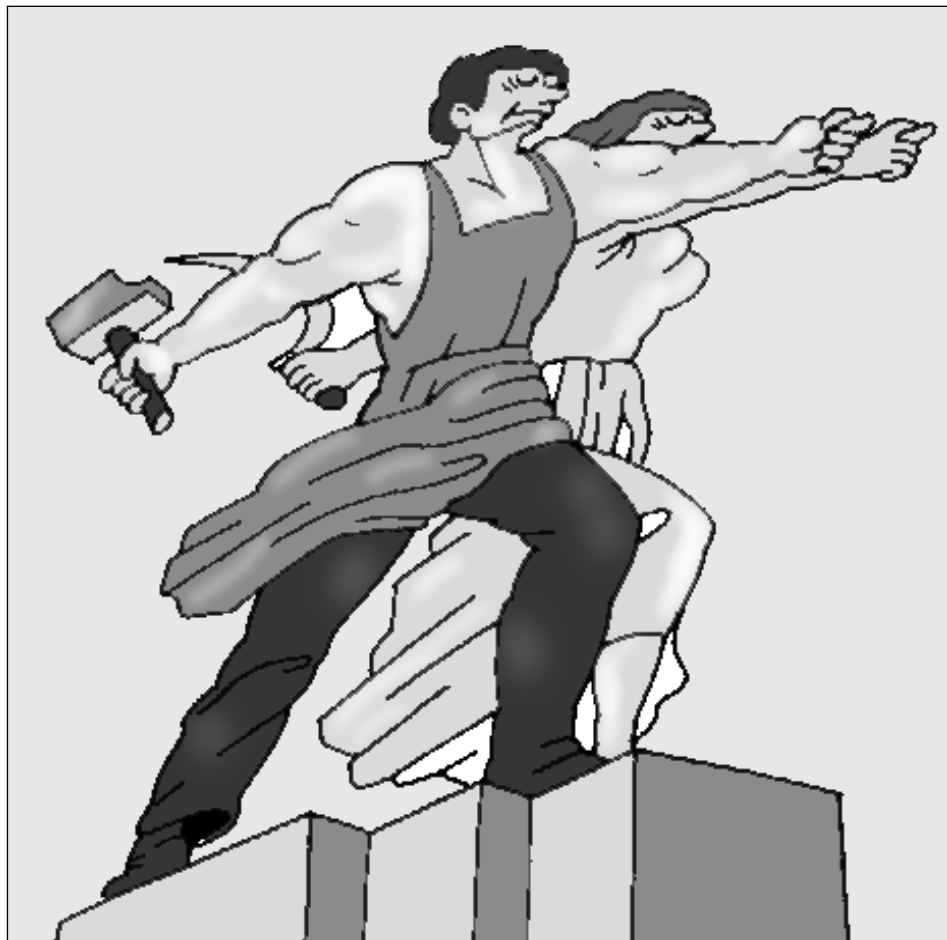
Рисунок Валентина Дружинина.

веро-западных областей страны не покупать больше молочные продукты из Эстонии и тем самым выразить свое отношение к зарвавшимся национал-фашистам этой страны. Слушаешь подобные предложения с изумлением. Прозвучи они из уст председателя колхоза или депутата райсовета, был бы понятен их гражданский пафос. Но заявлять об этом одному из руководителей правительства, значит, расписываться в собственном бессилии. Мелкая соседская страна топчет сапогами нашу память о павших, а государство делает лишь какие-то вялые, маловразумительные заявления. Что это, если не воспитание антипатриотизма или, как говорил великий русский писатель, «непротавление злу насилем».