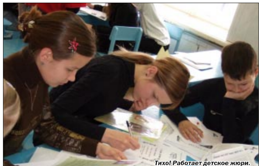
Тихо! Работает детское журю.

В какой-то момент мне вдруг показалось, что я снова вернулся в пору детства, что я снова в пионерском лагере. Мы даже, по традиции, стали обмениваться телефонами и электронными адресами с новопробренными друзьями. Такого рода атмосфера царяла на финале фестиваля школьной и молодежной самодельной прессы «Репортер», который проходил в минувшее воскресенье в здании школы №11 города Воронежа. Число участников составило 149 человек, из них детей - 129. Организатором этого, девятого по счету, фестиваля, как, впрочем, и предыдущих, выступила Воронежская региональная общественная детская организация «Искра» при активном содействии автономной некоммерческой организации «ИРИС» (г.Москва).