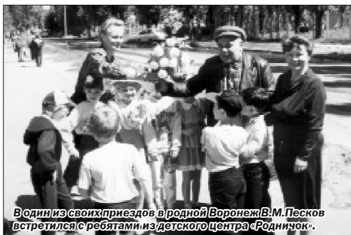
В один из своих приездов в родной Воронеж В.М.Песков встретился с ребятами из детского центра «Родничок».