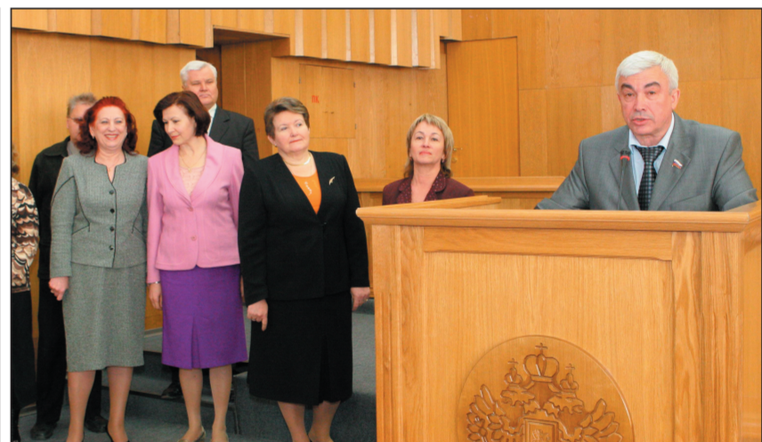
Новые члены облзбиркома (слева).

• «Об обращении депутатов Воронежской областной Думы к Председателю Государственной Думы Федерального Собрания Российской Федерации Б.В. Грызлову, Председателю Правительства Российской Федерации М.Е. Фрадкову по вопросу о предоставлении мер социальной поддержки инвалидам и семьям, имеющим детей инвалидов, в виде скидки в размере 50 процентов на оплату жилого помещения независимо от вида жилищного фонда».