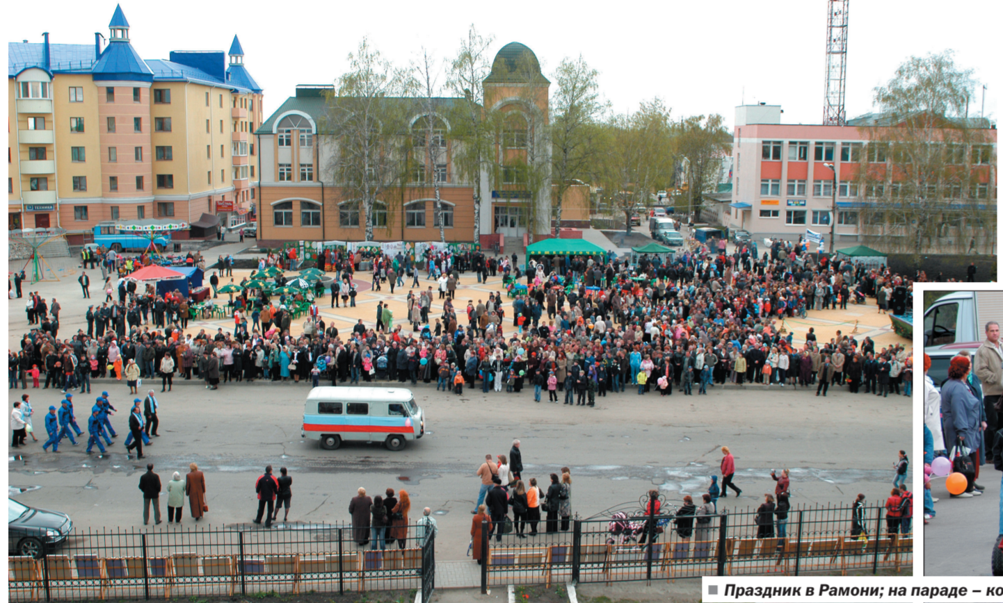
Праздник в Рамони; на параде – коммунальщики.