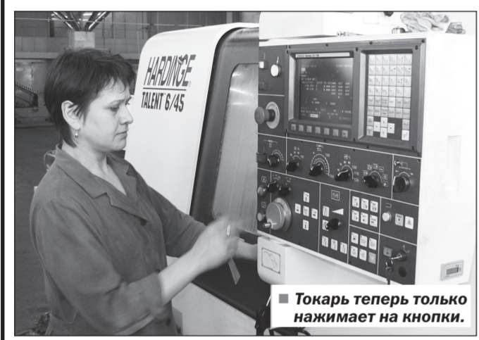
Точка теперь только нажимает на кнопки.