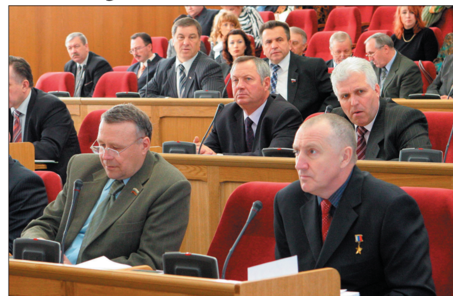
Идет заседание Думы.