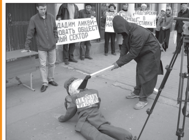
Своеобразная акция протеста прошла 3 мая возле дома № 5 на улице Пушкинской, где располагается городской комитет по имуществу.