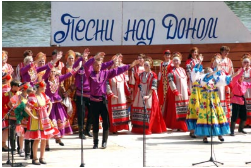
В субботу в Верхнем Мамоне завершился музыкальный фестиваль-эстафета «Песни над Доном». Он проходил в мае-июне, а его участниками стали солисты и самодеятельные песенные коллективы Воронежской и Липецкой областей. Подробнее о фестивале «Коммуна» расскажет.