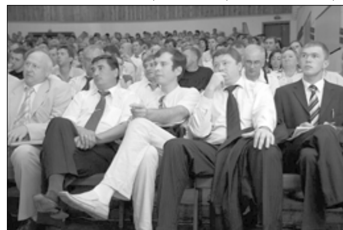
Депутаты слушают мэра.