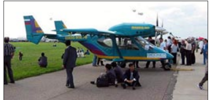
Один из проектов малой авиации – самолет-амфибия «Акорд-201» – на авиасалоне в Жуковском.