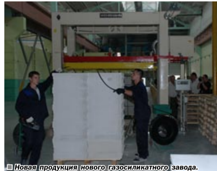
Новая продукция нового газосиликатного завода.

Сергей Кириенко: «Новым энергоблоком быть!»