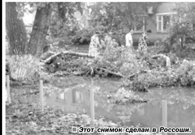
Этот снимок сделан в Россоши.

На седьмой странице – репортаж нашего корреспондента из Россоши