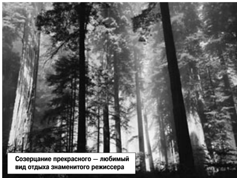
Созерцание прекрасного — любимый вид отдыха знаменитого режиссера

— Сколько времени вы спите? — Как все, часов семь, если не болит голова. — И при этом выглядите замечательно... — Краситься я перестала не так давно, за маникюром периодически слежу, волосы иногда укладываю, даже выкраиваю время на бассейн. На самом деле мне вовсе не чуждо желание хорошо одеться и красиво накраситься, но с годами все стало проще. Дочь иногда ругает меня, но я люблю спортивный стиль — джинсы, кроссовки. — У вас есть дача? — Кажется, да (смеется). — Вы любите там бывать? Дача для вас это место для пикников или место единения с природой и отдыха для души? — Дача для меня — место, где мои студенты знакомятся друг с другом. — Некоторые выезжают на дачу, радикально меняют свой рацион на «деревенский» — молоко, картошка, овощи, зелень. У вас меняется система питания на даче и вообще образ жизни? — Нет. У меня небольшой, но цивилизованный домик с телефоном и горячей водой, поэтому никаких изменений по сравнению с жизнью в городе не происходит.