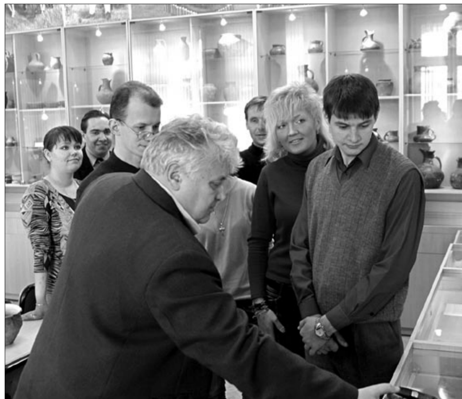
В музее исторического факультета ВГУ всегда много посетителей. И не только студентов. Воронежцев привлекают тематические выставки, на которых представлены археологические артефакты, найденные учеными и студентами во время полевых практик.