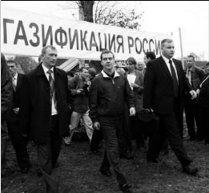
на 5-й стр.