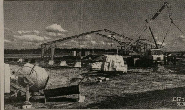
Уже намечались первые контуры свинокормильни.

Немногом свыше 60 тысяч тонн мяса в год – птицы, говядины, свинины вместе взятых – производит сегодня вся Воронежская область.