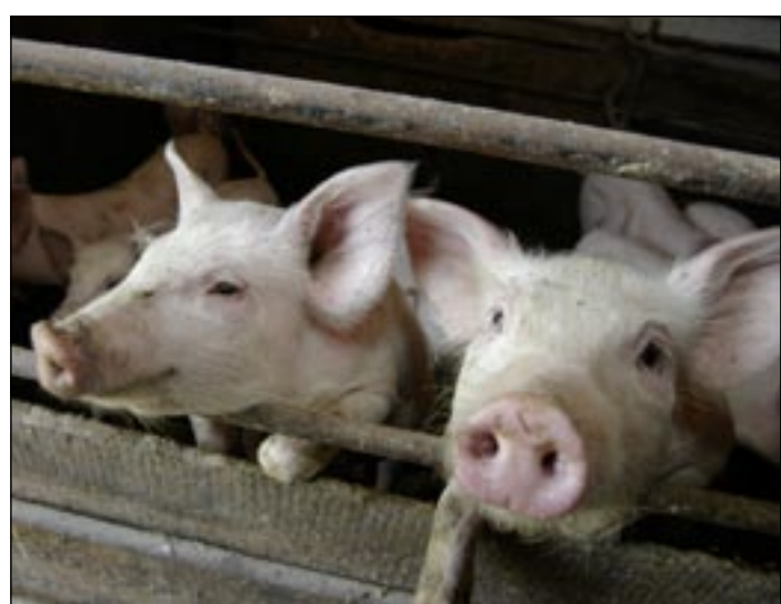
В Год Свиный хрюшки надеялись на лучшую жизнь.

согласения по импортным поставкам и квотам подписаны с США на период 2007-2009 годов. Обязательства по этим соглашениям Россия выполняет исправно.