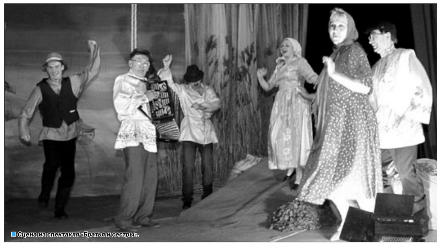
Сцена из спектакля «Братья и сестры».

В новом спектакле она соединяет мотивы двух романов Абрамова – «Братья и сестры» и «Две зимы и три лета». Ос-