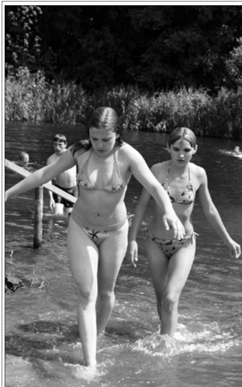
В разгаре школьное лето, тем более что теплая погода радует ребят. Этот снимок сделан в лагере отдыха в Аннинском районе.