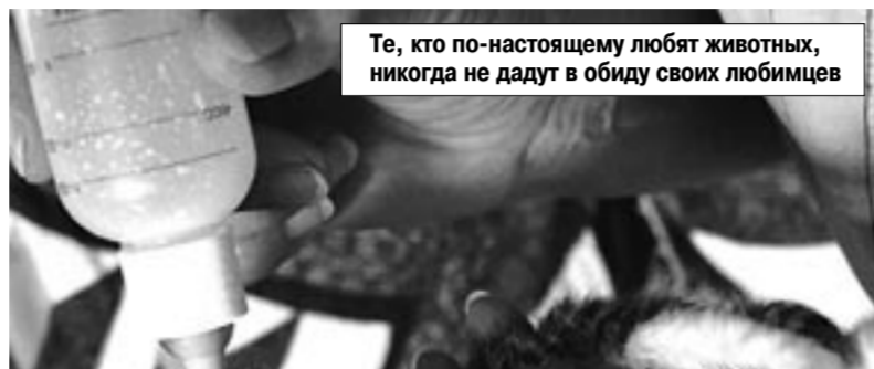
Те, кто по-настоящему любят животных, никогда не дадут в обиду своих любимцев

— А в октябре, куда предпочитаете ездить? — Я езжу на Кипр, где постоянно живу в одном и том же отеле. Мне нравится, что там спокойно, ничего не меняется, нет того психоза, который здесь на каждом углу, там чистый воздух, потрясающий большой пляж.