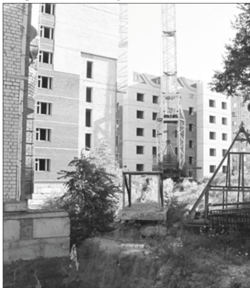
На брошенной стройплощадке царствует буйная растительность.