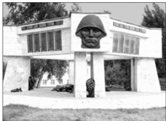
Эртильцы хранят память о земляках, павших на полях войны.

Подборку подготовили: Виктор СИЛИН и Михаил ВЯЗОВОЙ (фото).