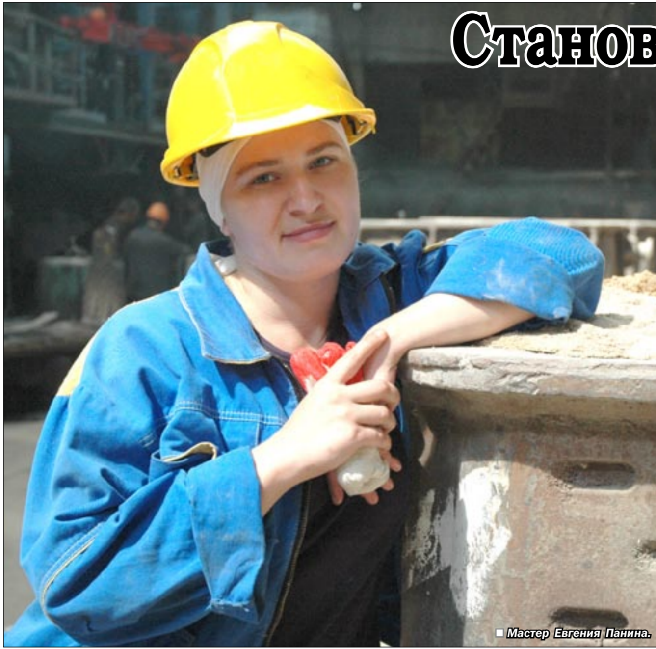
Мастер Евгения Панина.

Губернатор Воронежской области В.Г. КУЛАКОВ Председатель областной Думы В.И. КЛЮЧНИКОВ