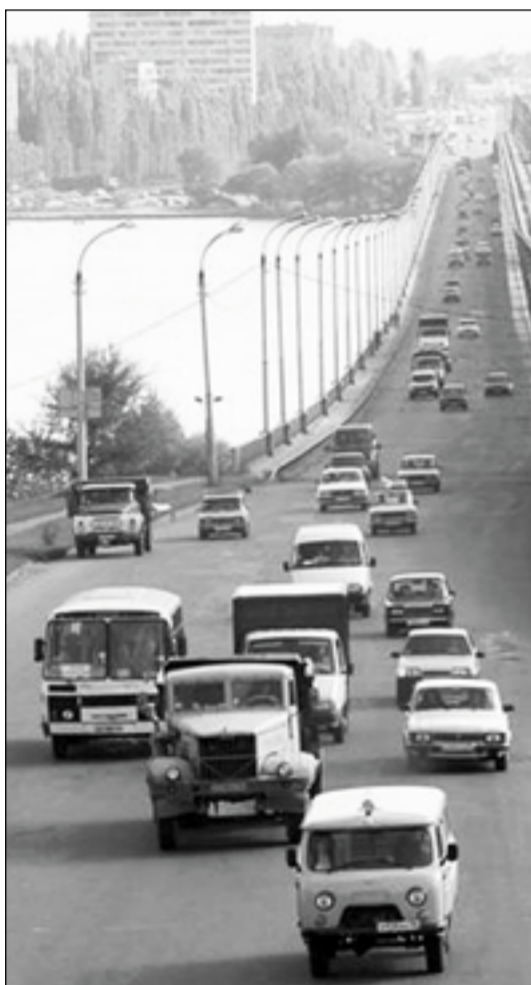
■ Сейчас трудно представить Воронеж без автомобилей. А иногда так хочется...

В Воронеже появился первый автомобиль. И тогда же произошло первое дорожно-транспортное происшествие