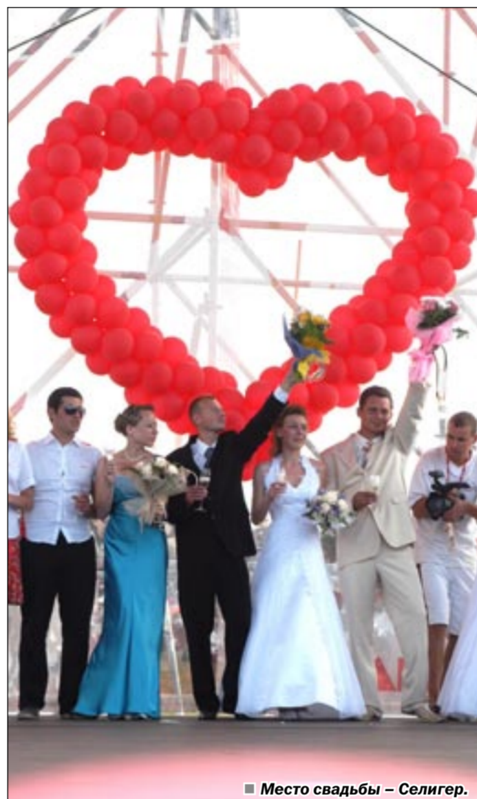
Место свадьбы – Селигер.

В этом году в молодежный лагерь ребята пригласили губернаторов из своих регионов, чтобы представить им свои инвестиционные проекты, показать фотовыставки, плакаты, рассказывающие о том, в какой стране ребята хотят жить, какую политику они будут проводить, какие принципы гражданского