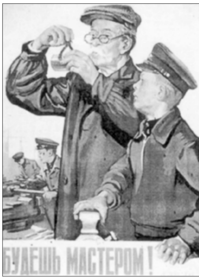
Этот плакат возвращает нас в прошлое, когда заботились о рабочей силе.