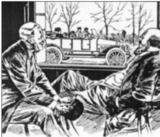
— Божье наказание! Выхватив на автомобиль за город, подышать чистым воздухом, дать отдохнуть нервам среди деревенской обстановки! Как-то незаметно завладеть тем счастливицам, которые ищут хороший автомобиль! — Этакая счастливица и ты можешь быть; ах, как стоить тебе пойти в Торговый Домъ „Победа“