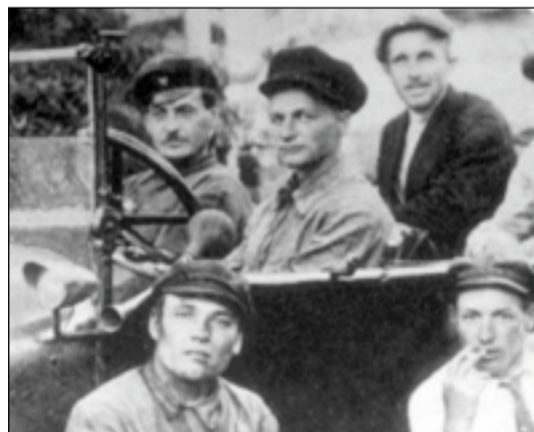
■ Наш земляк писатель Андрей Платонов за рулем автомобиля. Воронеж. 1920 годы.