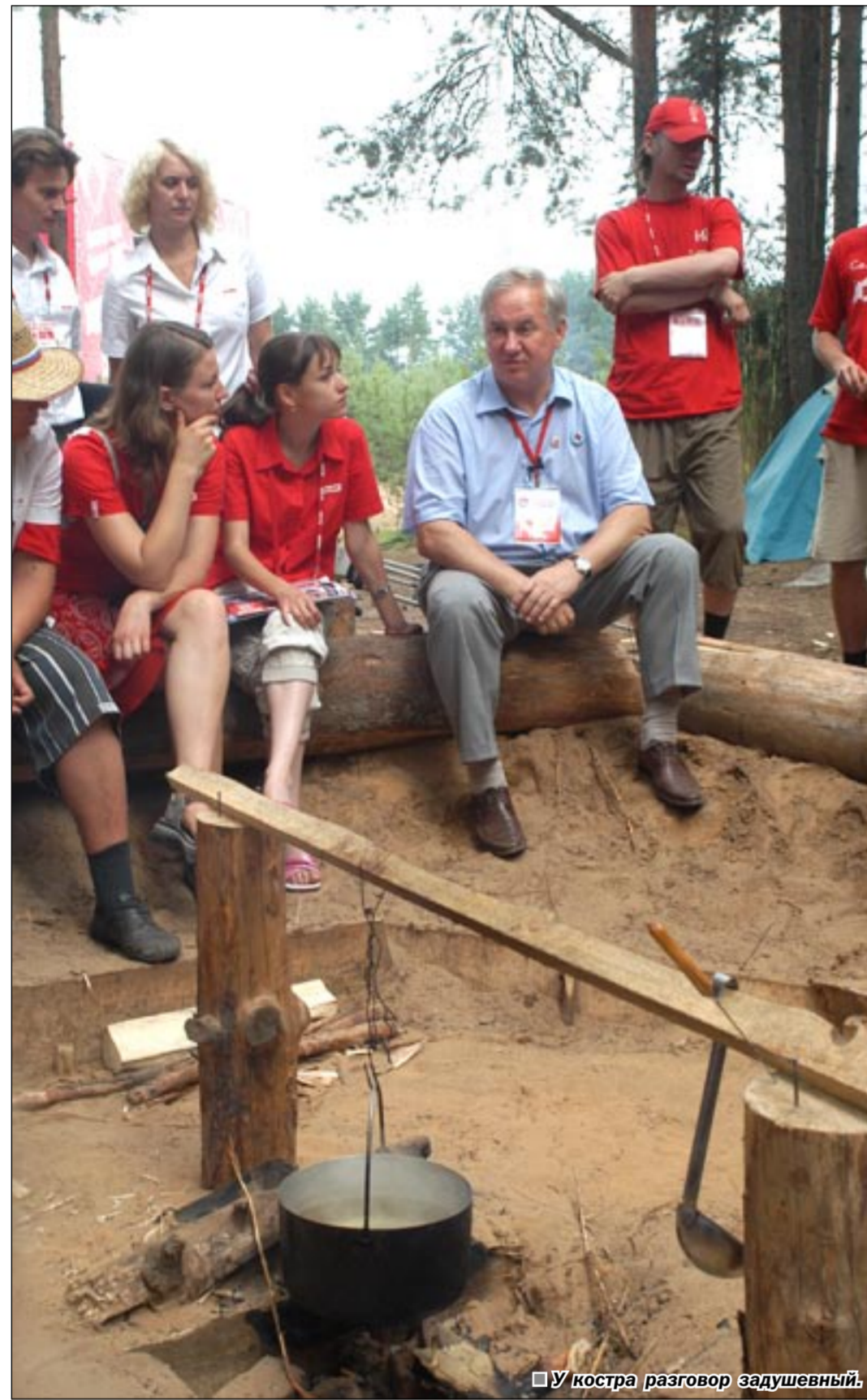
У костра разговор душевный.

В Тверской области есть прекрасное место – озеро Селигер – исток трех великих русских рек – Волги, Днепра и Двины. Тихий, живописный край, который летом уже три года подряд преображается в десяти тысячный молодежный город в лесу. Со всех уголков нашей страны съезжаются юноши и девушки, чтобы пообщаться со своими сверстниками, послушать лекции ведущих ученых, политиков, представить свои инвестиционные проекты, поучаствовать в дебатах и просто попеть душевные песни у костра. Два года назад молодежный город на берегу озера Селигер вмещал 3 тысячи участников всероссийского образовательного лагеря. Сегодня их десять тысяч. Самая многочисленная делегация – почти 500 человек – из Воронежской области.