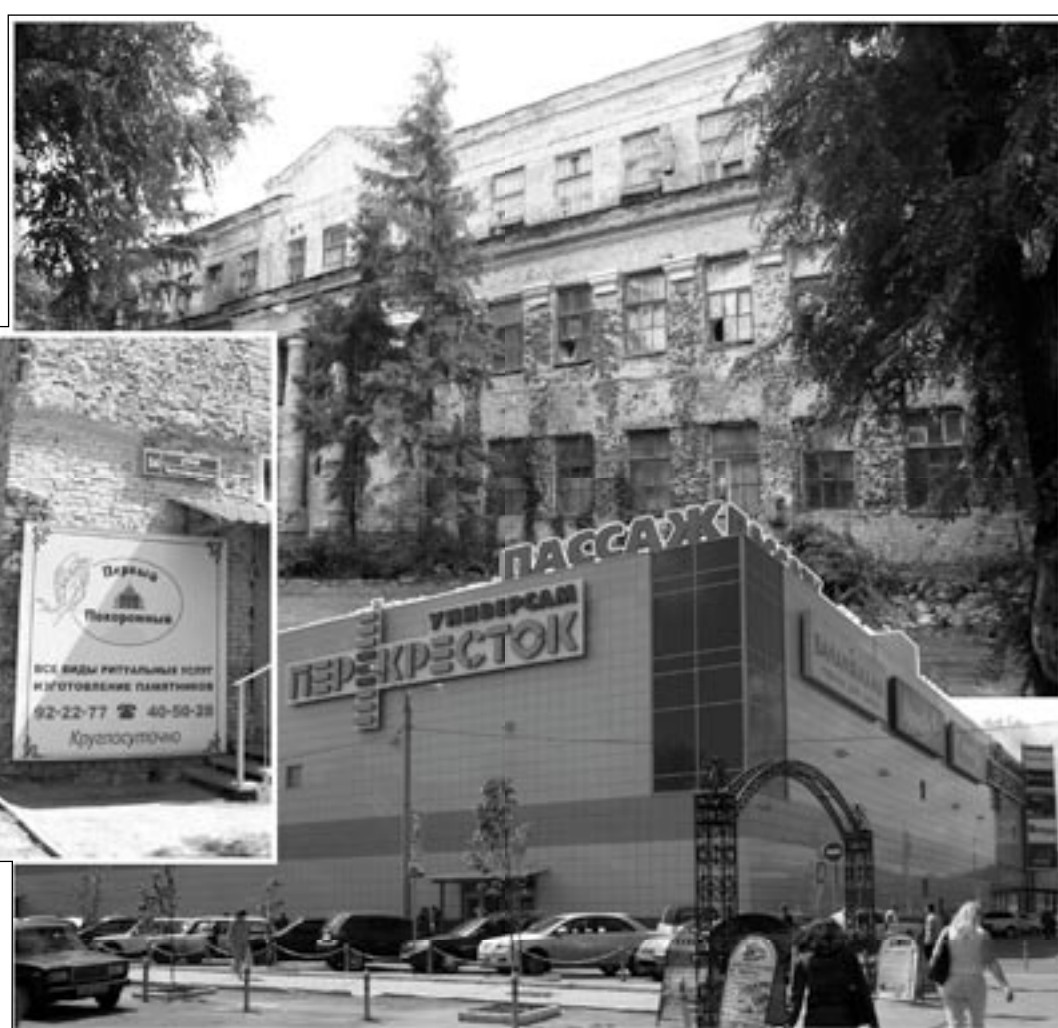
Обшарпанные стены «Энергии», сияющей «Пассажи»... – все это рядом. А между ними как символ – «Первый похоронный» в бывшем корпусе концерна.

Вот оно, событие, явно заслуживающее того, чтобы быть продемонстрированным в передаче «Очевидное – невероятное!» Все обвинение, по сути дела, было целиком и полностью построено на том, «доказанном» следствием, «факте», что 20 августа 2001 года бывшие топ-менеджеры концерна «Энергия», в глубокой тайне, «по предварительному согласию», изготовили заведомо подложный протокол, благодаря которому им и удалось совершить хищение на сумму 7 миллионов рублей с копейками, «что является особо крупным размером». А в зале судебного заседания нежданно-негаданно появились целых 47 человек, во плоти и крови, все – члены пресловутого совета директоров, которые уверенно опознали свои подписки и дали показания, однозначно свидетельствующие о том, что никакой фальсификации не было.