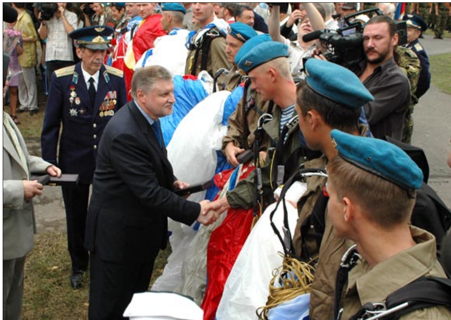
■ Бывший десантник Сергей Миронов приветствует сегодняшних.

Вчера в Воронеже с однодневным визитом побывал Председатель Совета Федерации РФ Сергей Миронов