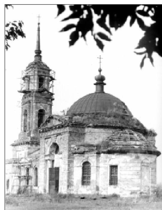
Церковь Преображения в кантемировской Кулиновке ждет реставраторов.