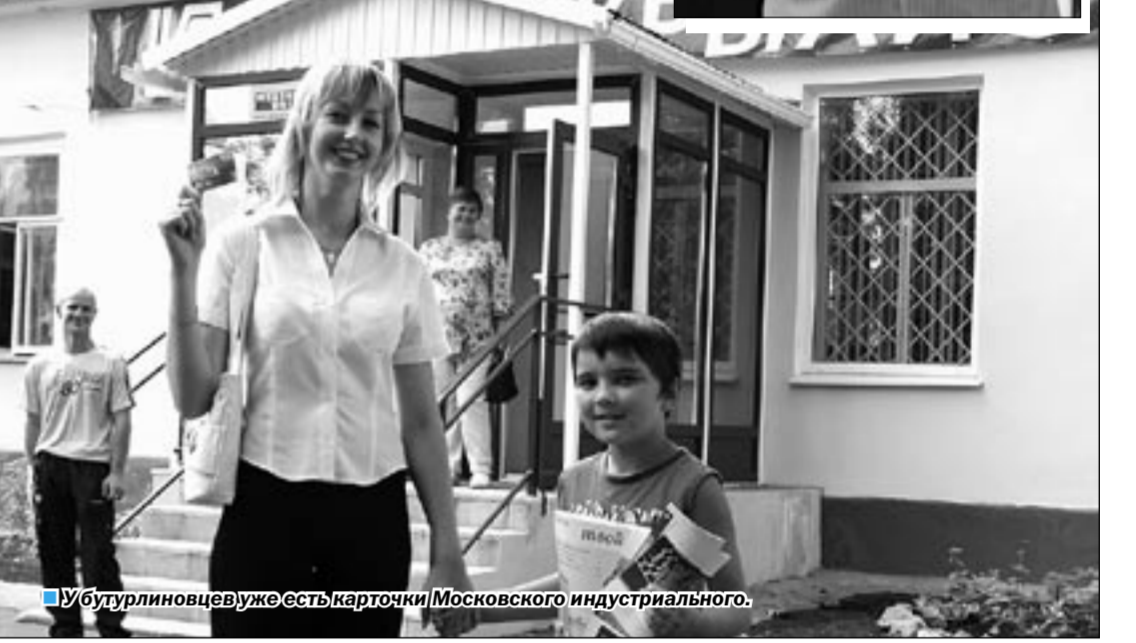
В Бутурлиновке уже есть карточки Московского индустриального.