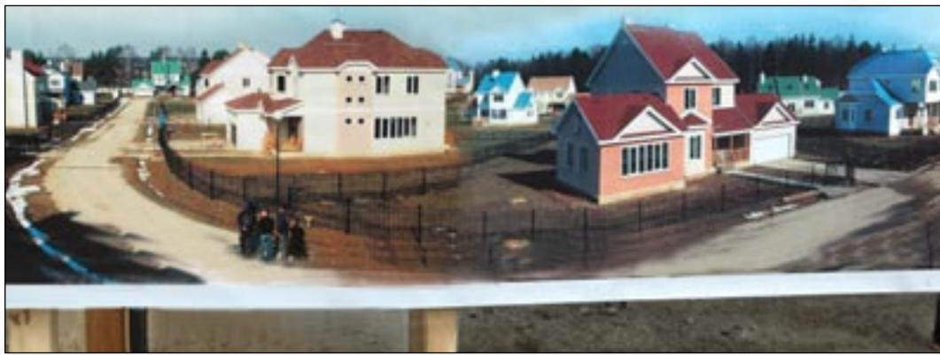
Достойное и комфортное жильё пока больше на рекламных планшетах.