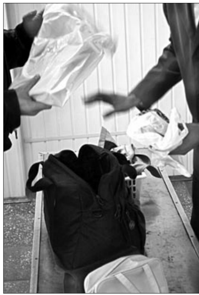
Германию животное без такого чипа не пустят.

с собой огромное количество сувениров для родственников и друзей. Однако, приобретая на граничных рынках подарки, не всегда задумываются, как будут со всем этим добром пересекать границу. Первое, от чего таможня советует отказаться, - коллекционные оружие. Очень трудно доказать на границе, что пытаешься пронести в самолет не холодное оружие, а всего лишь сувенир для лучшего друга. Бывает, что, потратив уму времени на экспертов и согласование с МВД РФ, человек так и не получает разрешение на ввоз своей покупки. Далее - в рейтинге - любители экзотических сувениров. Они, естественно, не пройдут мимо учла животного, сушеного краба, двухколесной ракушки или редкого коралла. Опять же, если вы слукавите на таможенном досмотре той страны, откуда пытаеься все это вывезти, могут возникнуть большие проблемы. К примеру, те же учла животных могут подпадать под действия конвенции о международной торговле редкими видами флоры и фауны СИТЕЗ. По закону на вывоз таких сувениров необходима масса разрешительных документов как фитосанитарного, так и ветеринарного контроля. И собрать их за 10 дней отдыха практически нереально.