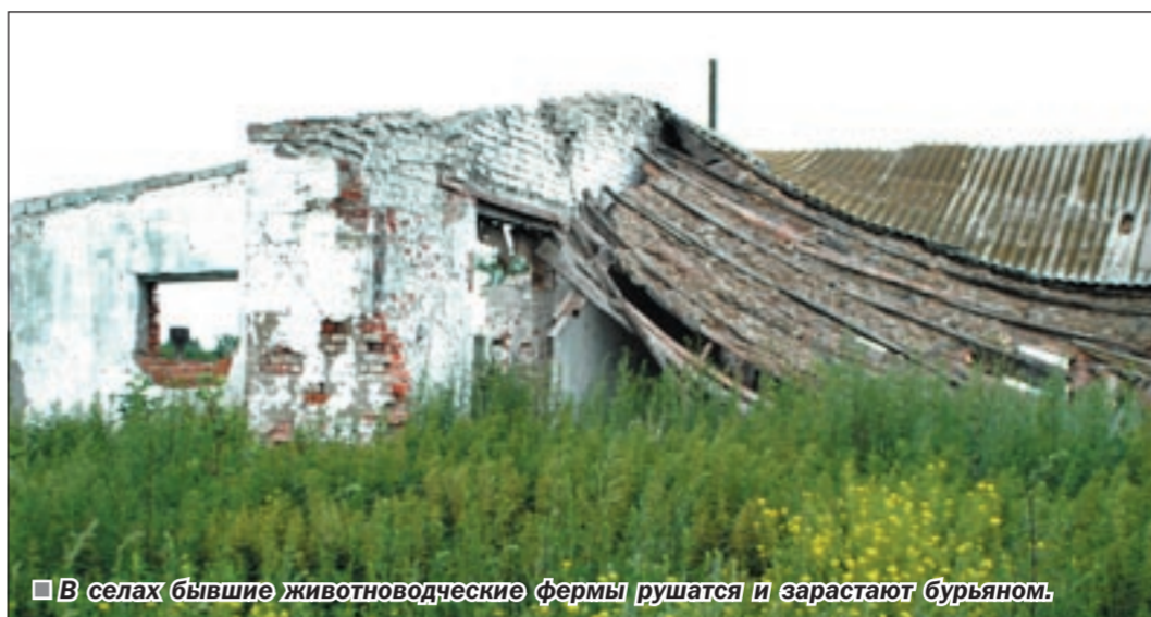
В селах бывшие животноводческие фермы рушатся и зарастают бурьяном.

наш хутор Дмитриевка и село Острянка входили в колхоз им. Ленина. В нем был мощный машинно-тракторный парк, многогосподнее поголовье крупного рогатого скота, овец и свиней. Но началась перестройка, всеобщий развал, и колхоз стерли с лица земли. Скот порезали, фермы порушили, дельцы набили свои карманы, а нас оставили в разбитом хуторе. Теперь большинство хуторян находится в жалком прозябании.