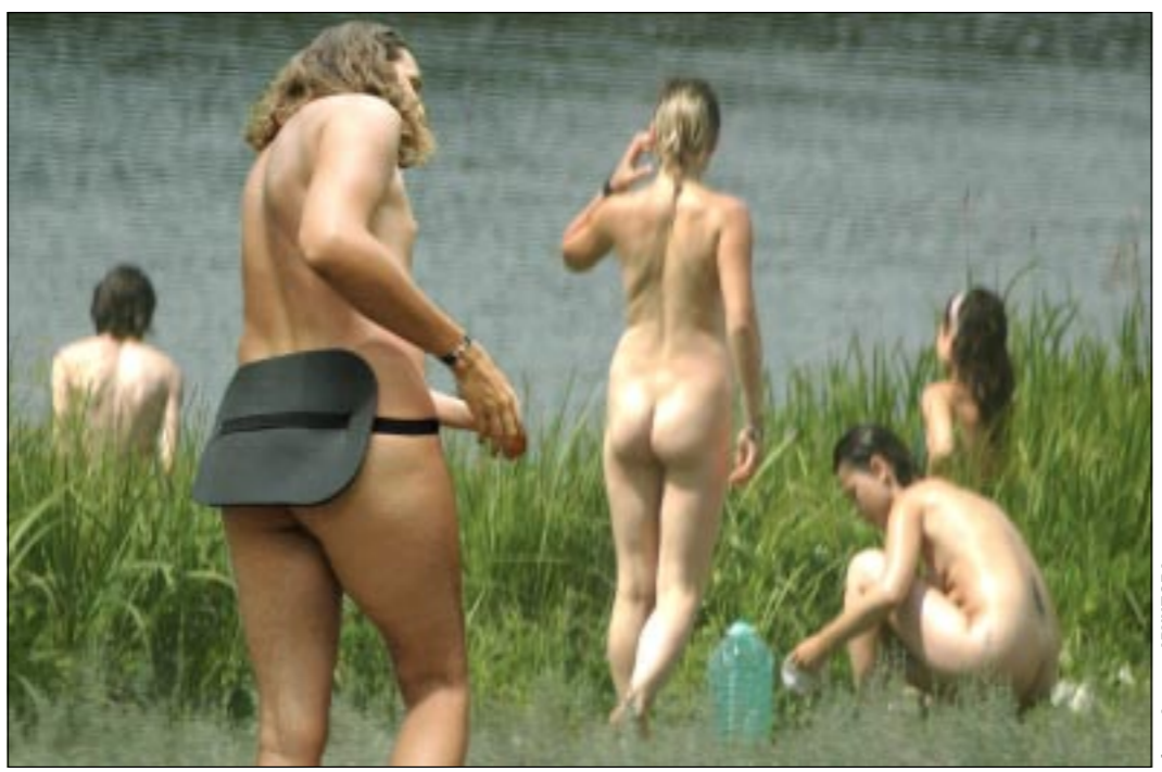
Вот так тусовалась «семья Радуга».