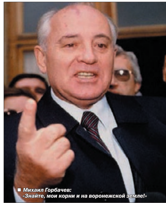
Михаил Горбачев: «Знай, мои корни и на воронежской земле!»