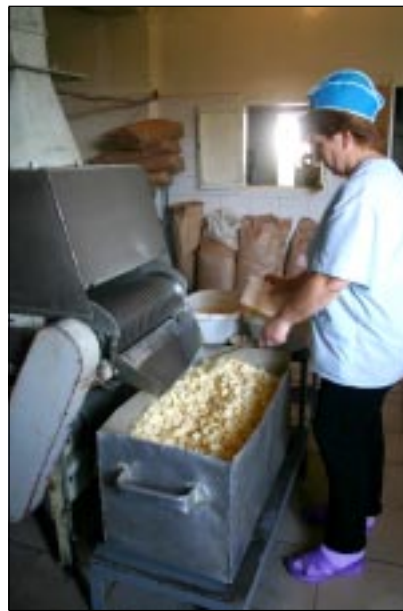
■ Эта партия воронежских чипсов – только что из обжарки. Сейчас их посыплют специями и упакуют.