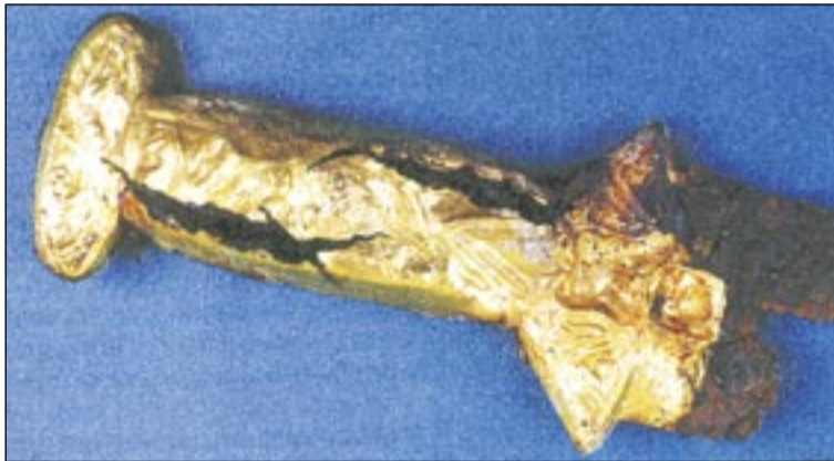
■ Меч с золотой рукояткой. с.Колбино.