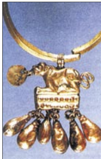
■ Золотая серьга с пантерой. с.Колбино.