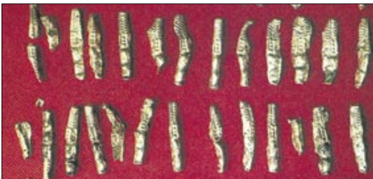
■ Бляшки из золотой фольги.