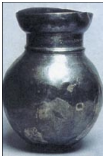
■ Серебряный греческий сосуд. с.Колбино.