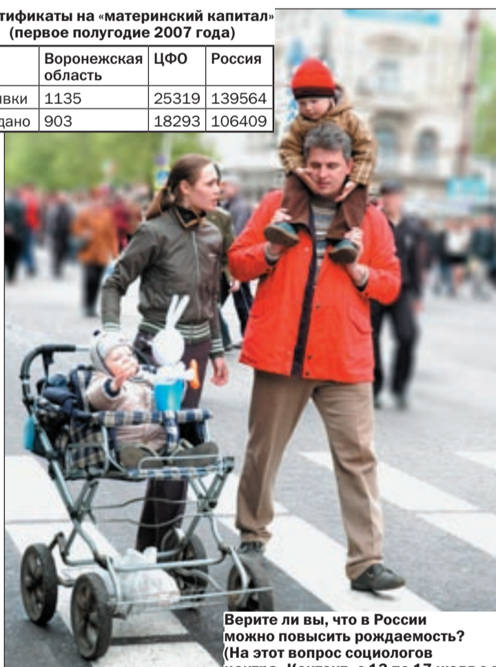
Верите ли вы, что в России можно повысить рождаемость? (На этот вопрос социологов центра «Контент» с 13 по 17 июля с.г. отвечали 200 воронежцев)