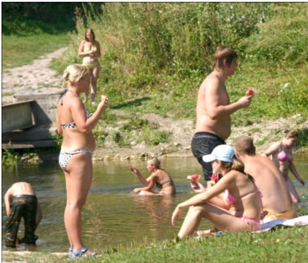
■ В эти жаркие дни любой водоем – от маленького пруда до Дона – в почете у воронежцев. Лишь окунуться, хотя бы на миг спрятаться от палящих солнечных лучей. Этот снимок сделан на берегу Тихой Сосны.