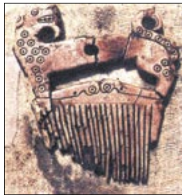
■ Роговой гребень с фигурой гепарда. с.Терновое.

Рядом с мужским скелетом археологи обнаружили железные наконечники стрел, два железных шила и еще один колчан с наконеч-