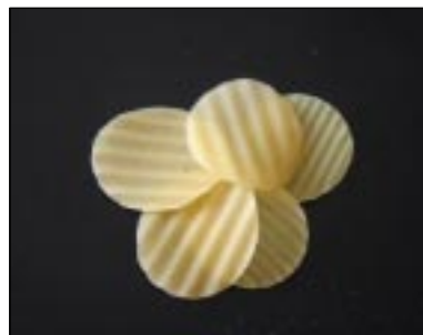
■ Из вот таких пеллет как раз и делают воронежские чипсы.

Фирма по производству чипсов есть и в Воронеже – она существует уже 12 лет. Три веселых мордочки на упаковке уже давно стали составляющей известного в области бренда. Речь, конечно, идет о фирме «СНЭК».