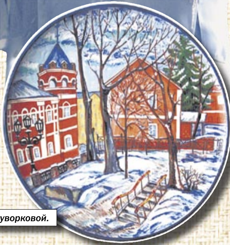
■ Работы Зои Суворковой.