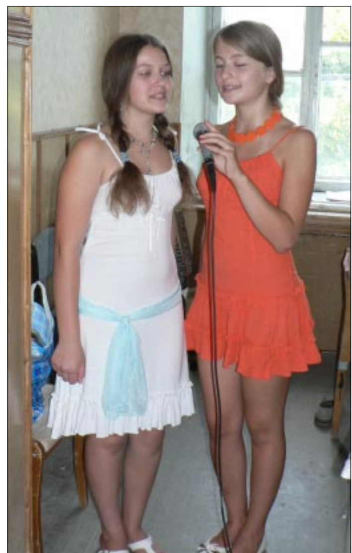
Репетируют солистки школьного ансамбля «Непоседы».

дится в две смены. И перехода на одну не предвидится. Здесь тоже учатся ребята из окрестных сел. В этом году педа-