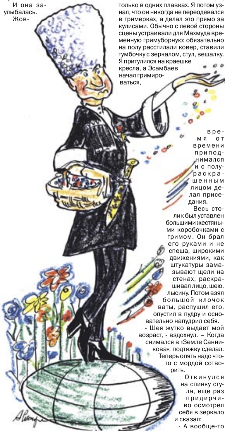
■ Он покорила весь мир