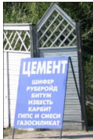
■ Что подорожает завтра?

Что ж, город Сочи к Олимпиаде наверняка отстроят по европейским стандартам, в том числе и за налоговые копейки моего соседа-