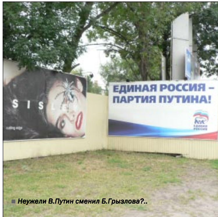
■ Неужели В.Путин сменил Б.Грызлова?..