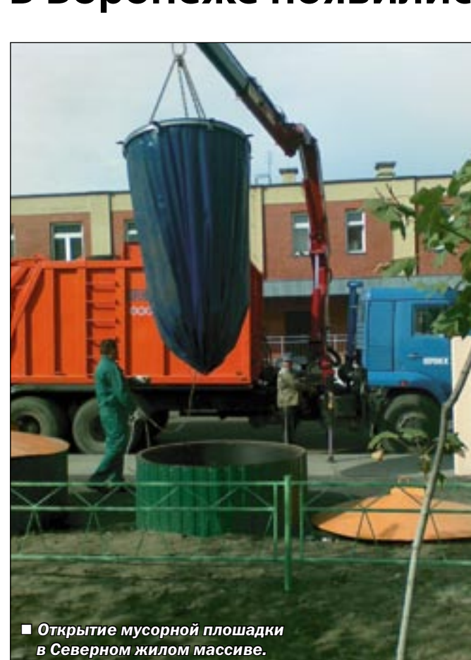
■ Открытие мусорной площадки в Северном жилом массиве.

В Воронеже появились мусорные контейнеры европейского образца