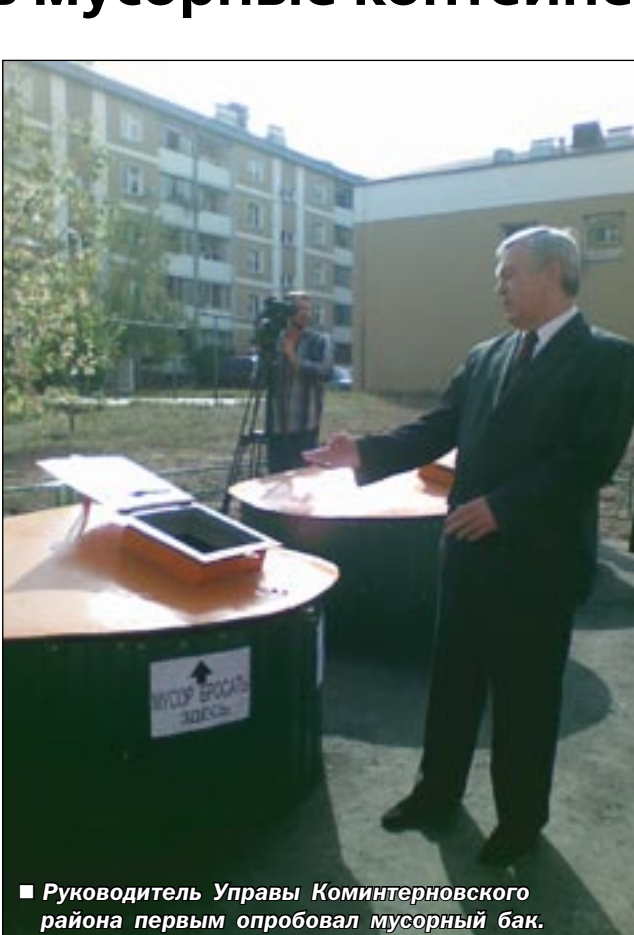
■ Руководитель Управы Коминтерновского района первым опробовал мусорный бак.

Две площадки с мусорными контейнерами, принимающими бытовые отходы строго по европейским технологиям, установлены на территории «немецкого» военного городка – в Северном микрорайоне Воронежа. Принцип работы устройства несложный: контейнеры вкапываются на два метра в землю, снаружи остается лишь крышка с отверстием. Через это отверстие мусор-то и попадает в специальный вместительный мешок, изготовленный из прочного и морозостойкого материала. Заметим, что новые контейнеры в пять-шесть раз вместительнее обычных. А содержимое мешков будут забирать специальные мусоровозы, каждый из которых может обслуживать до 40 контейнеров.