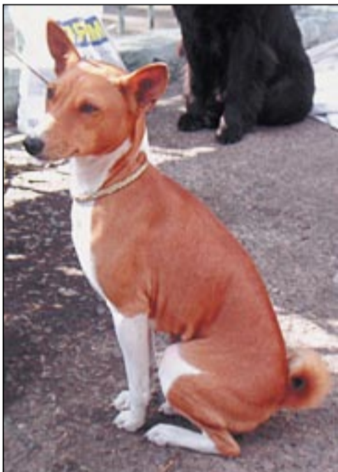
■ Бассенджи Зарина С Полярного Созвездия.