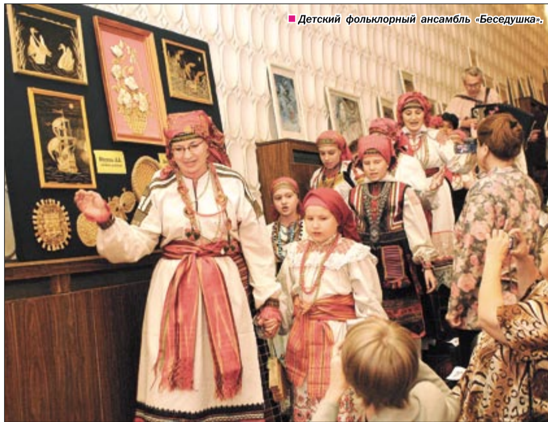
Детский фольклорный ансамбль «Беседушка».