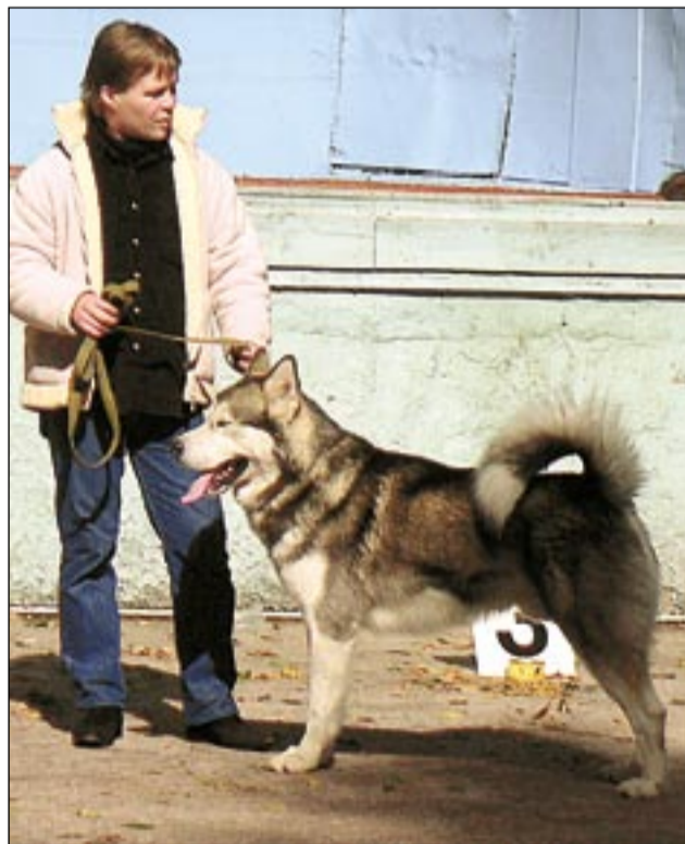
■ Аляскинский маламут.