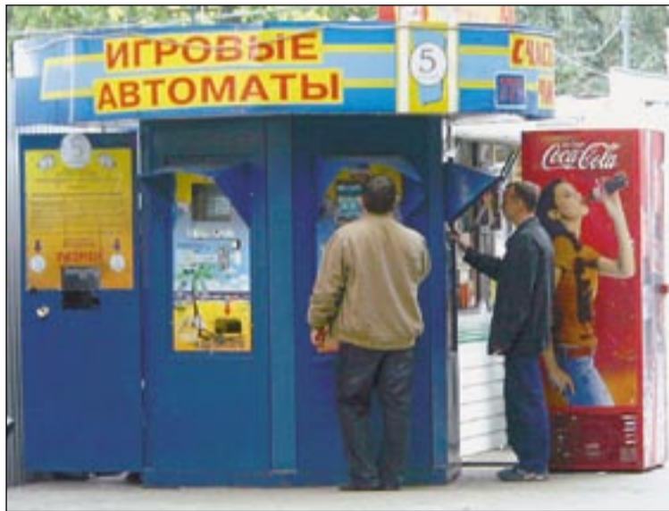
■ Этот снимок сделан вчера на улице Фридриха Энгельса.

Первыми под удар попали «ромашки», расположенные на рынках областного центра. Торговки сторонились, пропуская вперед автокран и грузовик. На то, чтобы оторвать от земли четыре «одноруких бандита» и погрузить их в машину, ушло менее получаса. До 1 июля все подобные объекты должны были исчезнуть с территории жилого сектора, учебных и спортивных заведений, рынков и объектов культуры. Ряд собственников проигнорировал этот закон. Их предупредили: не уберете добровольно – демонтируем и отпра-