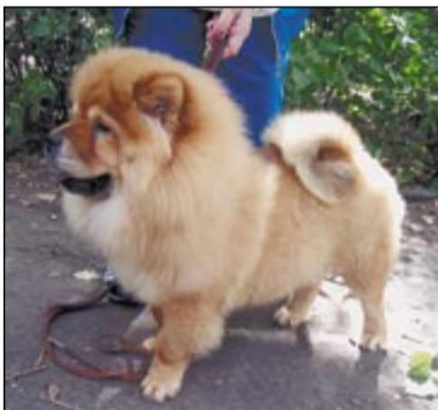
■ Чау-чау Ксавьер Ла Карте.