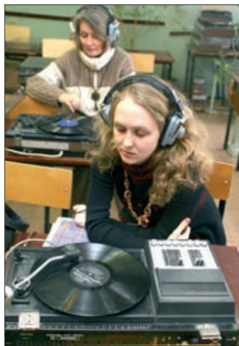
■ А музыка звучит...