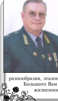
разнобразия, эталонном природной красоты Центрального Черноземья.