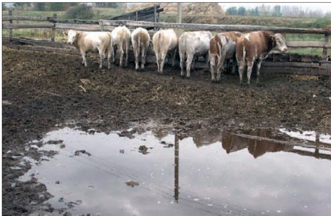
■ «Их в живых осталось только семеро...»