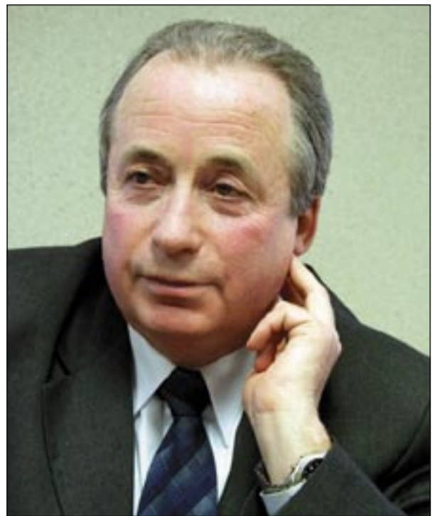
Яков Львович заявил в пятницу: «В самое ближайшее время все недостатки будут устранены». А в понедельник учителя неустанно звонили с жалобами в свой обком профсоюза...