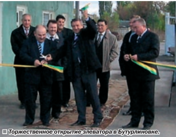
Торжественное открытие элеватора в Бутурлиновке.

Бизнес с «человеческим лицом» ведет в Бутурлиновском районе концерн «Детскосельский» из Санкт-Петербурга