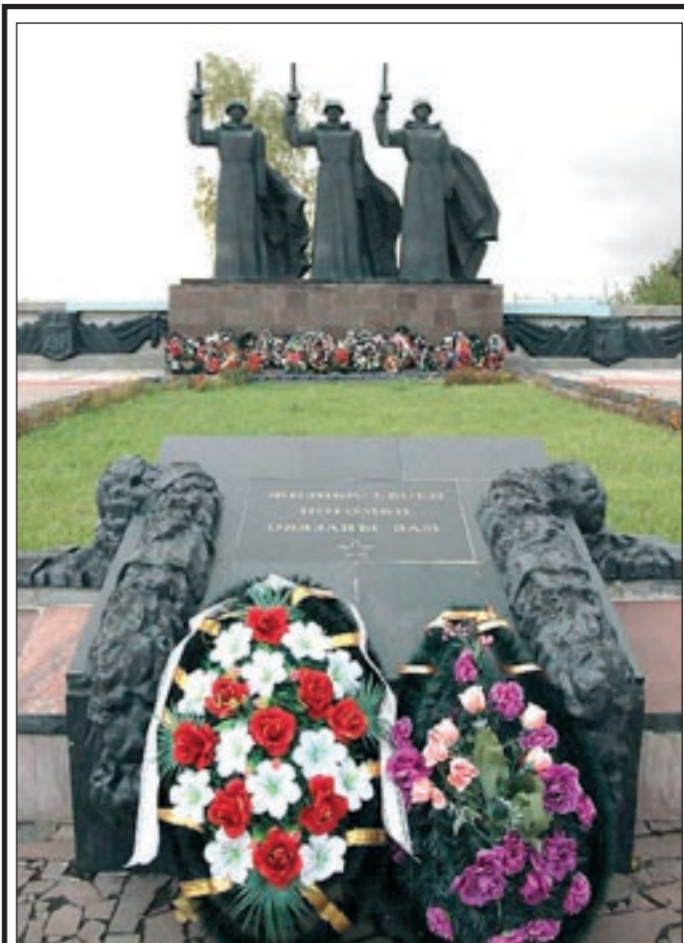
ОНИ ОСВОБОЖДАЛИ ВОРОНЕЖ