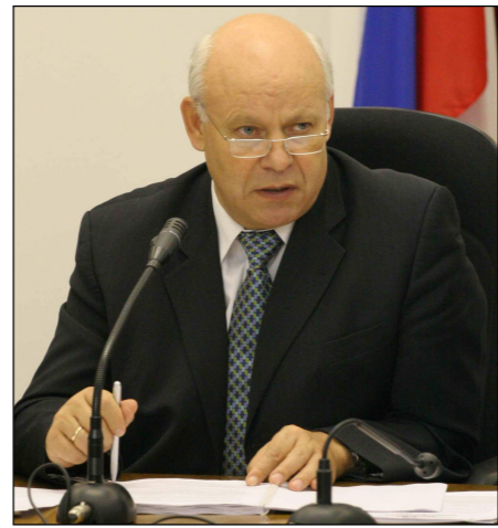
су или реконструкции» (внесён и.о. губернатора области);