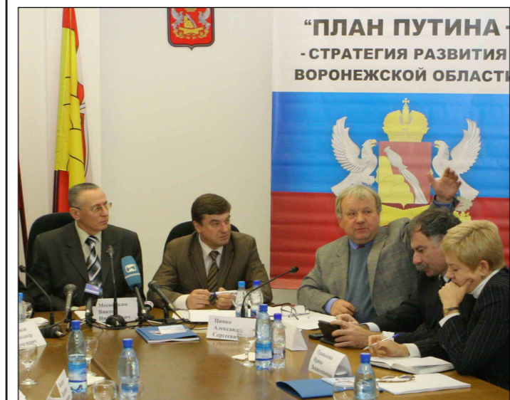
«ПЛАН ПУТИНА» - СТРАТЕГИЯ РАЗВИТИЯ ВОРОНЕЖСКОЙ ОБЛАСТИ