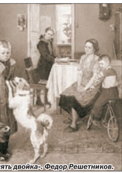
«Опять двойка». Федор Решетников.

Даниил Аль. Публикуется с разрешения «Литературной газеты».