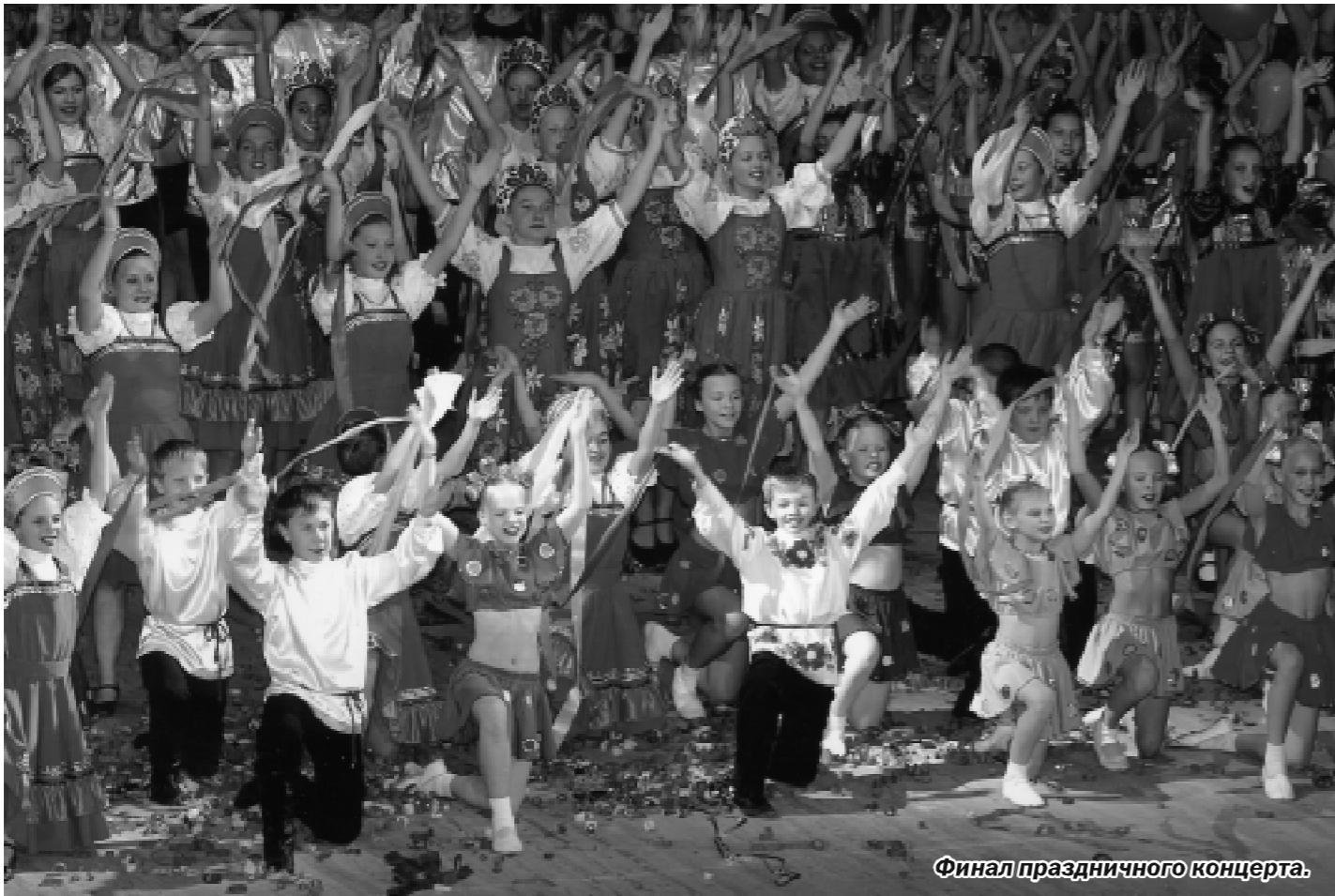
Финал праздничного концерта