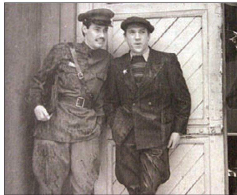
■ Кадр из фильма «Место встречи изменить нельзя».