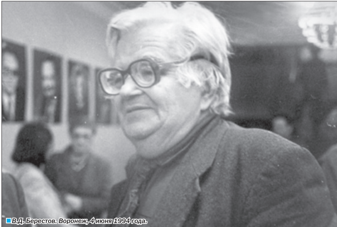
В.Д. Берестов. Воронеж, 4 июня 1994 года.

дождем я познакомился с исхудалым и болезненным мальчиком, который протянул мне тетрадку своих полудетских стихов...» Это происходило в грозном сорок втором.