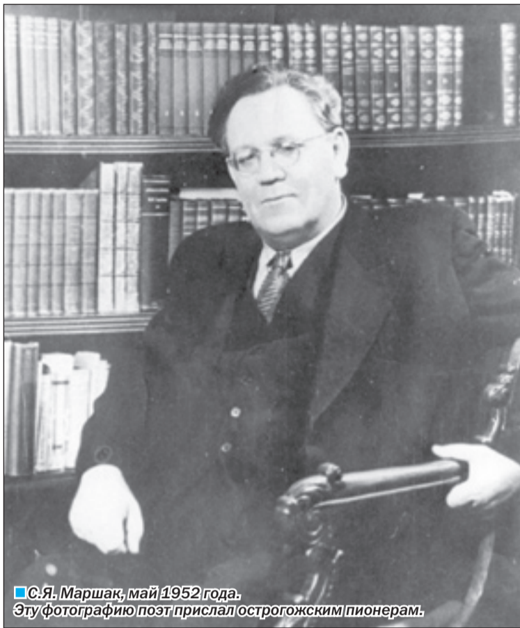
С.Я. Маршак, май 1952 года. Эту фотографию поэт прислал острогожским пионерам.

...На стихи юного Берестова навела Чуковского его дочь Лидия Корнеевна. Именно она сказала отцу, что есть мальчик (мальчиком его называла и Анна Андреевна Ахматова, а мальчишкой – Надежда Яковлевна Мандельштам) не без поэтических способностей. Чуковский заинтересовался. Впоследствии он напишет: «В Ташкенте, под весенним