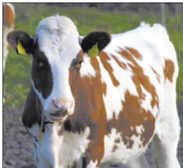
■ Телята здесь с «паспортами» в ушах.