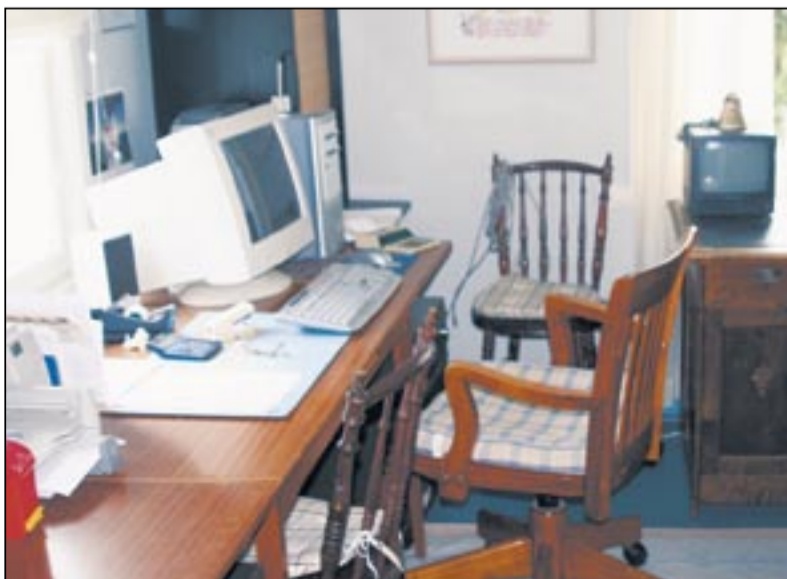
■ Рабочий кабинет фермера.