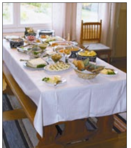
■ Обед от Микандеров.