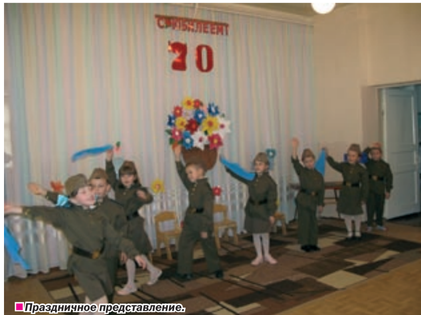
■ Праздничное представление.