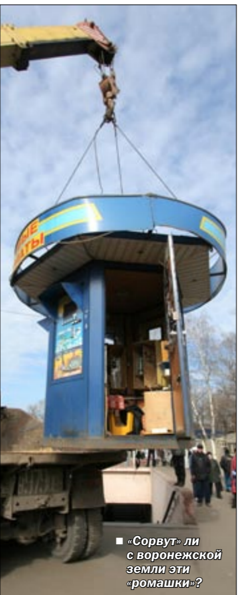
«Сорвут» ли с воронежской земли эти «ромашки»?

Я прошу в кратчайшие сроки решить поставленную мной задачу. И знайте, я добьюсь того, чтобы все без исключения незаконные игровые клубы и автоматы были закрыты.