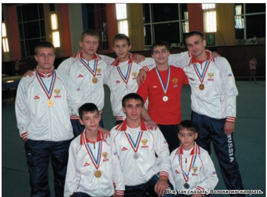
Вся, так сказать, Волокитинская ярать.

дерами и впоследствии никого к себе и близко не подпустили, хотя не скажу, что те же украинцы и болгары, соответственные, серебряные и бронзовые призеры первенства Европы были слабыми. Нет, просто наши ребята выглядели сильнейшими среди сильнейших.