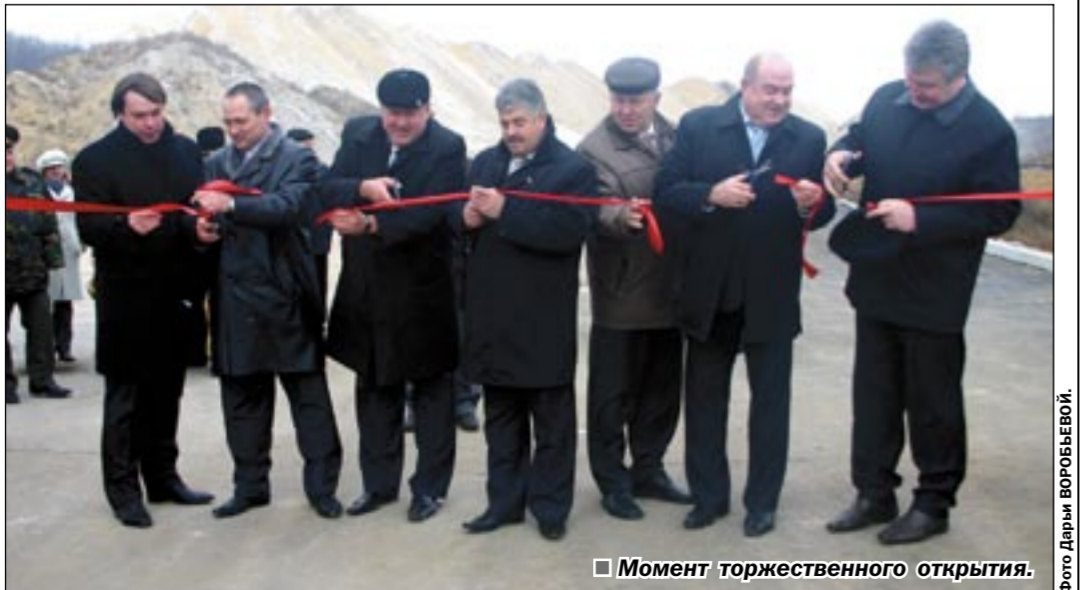
Момент торжественного открытия.