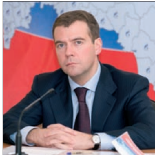
Дмитрий Медведев: «Подключение газа — один из малых праздников, которые мы можем сделать для наших людей».

газификация дома обошлась, как она считает, сравнительно недорого — 36 тысяч рублей. Но для учительницы начальных классов набрать такую сумму всё-таки оказалось не так-то просто. Из 35 газифицированных домовладений — больше половины их владельцы — пенсионеры. Однако они рассчитывают на помощь, так как в Воронежской области реализуется программа оказания адресной социальной помощи неработающим пенсионерам и малоимущим в газификации их домовладений. Для этих целей правление Пенсионного фонда выделило области 20 миллионов рублей. На необходимость оказывать помощь малоимущим гражданам в деле газификации обращал особое внимание глава региона первый вице-премьер правительства, председатель совета директоров ОАО «Газпром» Дмитрий Медведев, который лично курирует реализацию программы газификации страны. Несколько дней назад в Нижнедевицком районе был введен в эксплуатацию межпоселковый газопровод от АГРС села Синие Липяги до сёл Михнево и Глазово. В декабре будет введён третий в этом году межпоселковый газопровод — от АГРС Нижнедевицк к селу Лог с отводами к сёлам Новая Ольшанка — Кучуровы — совхоз «Нижнедевицкий» — хутор Широкий. Таким образом, из 15 сельских поселений в районе 13 будут с газом. Ввод этих мощностей позволит в Нижнедевицком районе достигнуть планируемого среднего по Воронежской области уровня газификации сельских районов региона — 90 процентов.