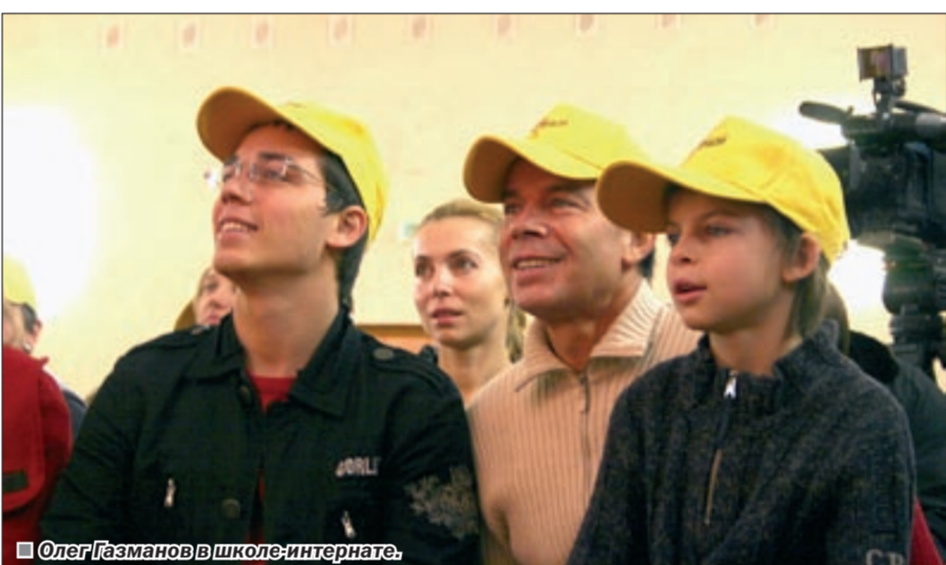
Олег Газманов в школе-интернате.