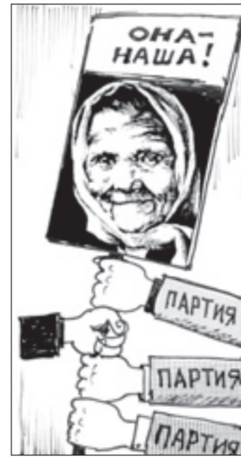
настроенные граждане. Главная их цель — пройти в Госдуму.

Напомним, 28 октября 2006 года Российская партия пенсионеров (РПП) была преобразована в ОО «Российские пенсионеры» и вошла в состав новой, «трисидной» партии «Справедливая Россия. Родина. Пенсионеры. Жизнь». Единства не получилось. Делегаты съезда считают, что «новым социалистам XXI века не нужны ни пенсионеры с их нуждами, заботами и организациями в центре и на местах, ни патриотически