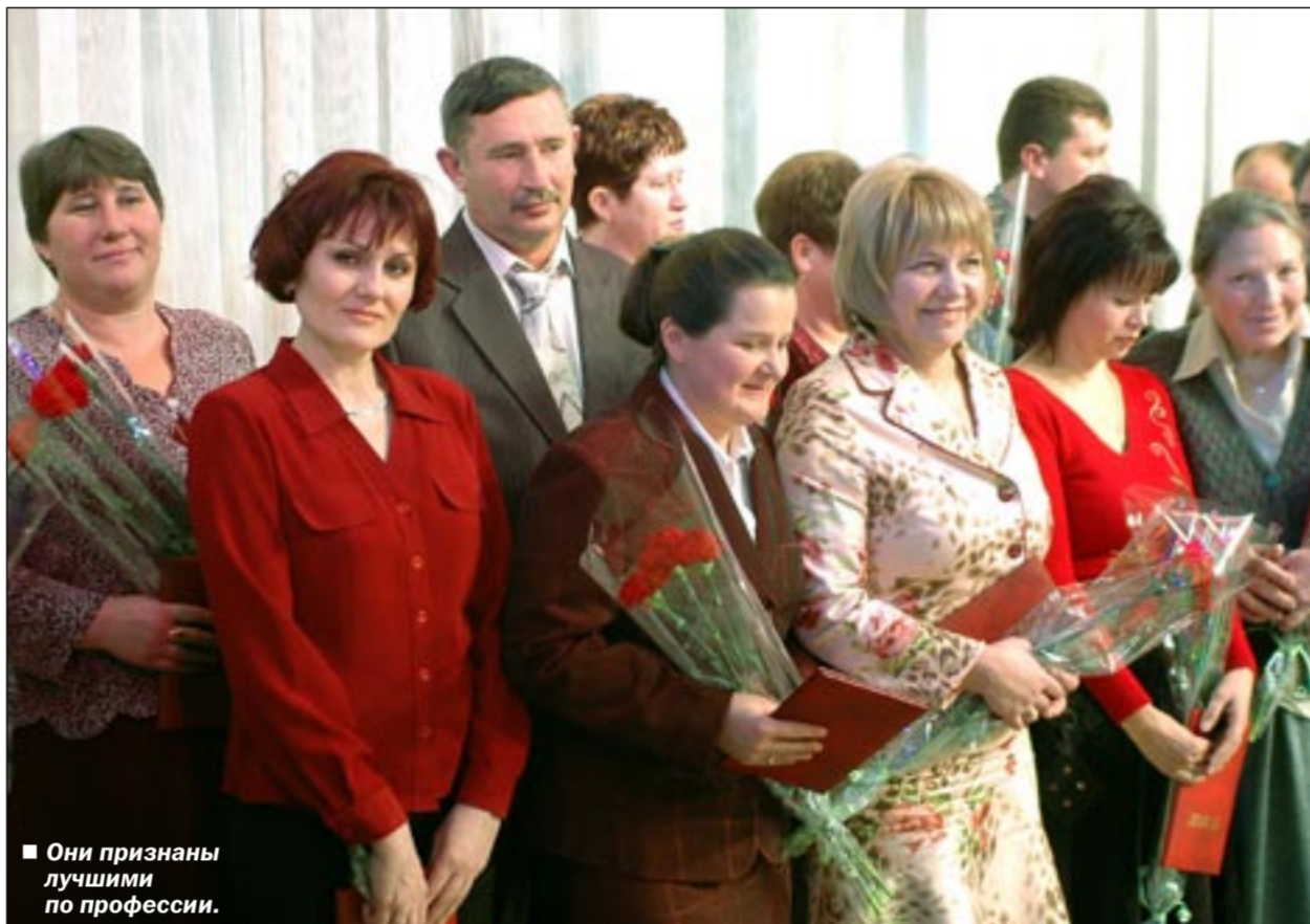
Они признаны лучшими по профессии.

Импульс в животноводстве, заложенный программой национального проекта «Развитие АПК», привел к тому, что введены в эксплуатацию молочно-комплексы в Лискинском и Каменском районах, стали давать продукцию первая и вторая очереди свиноккомплекса в Калаче, «ЛИСКИБройлер» реализу-