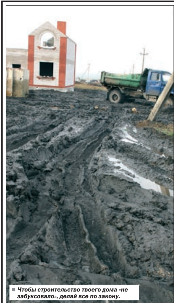
■ Чтобы строительство твоего дома «не забуксовало», делай все по закону.