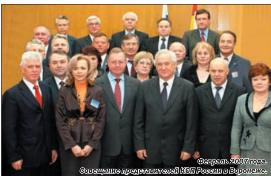
Февраль 2007 года. Собрание представителей КСП России в Воронеже.

Результаты нашей работы можно оценить не только по выявленным фактам нецелевого использования средств. Так, после нашей проверки Главного управления труда и социального развития произошли позитивные изменения: 15 учреждений оборудованы автоматичес-