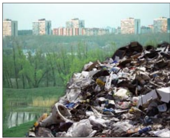
Мусор наступает на Воронеж. Как защитить город?..