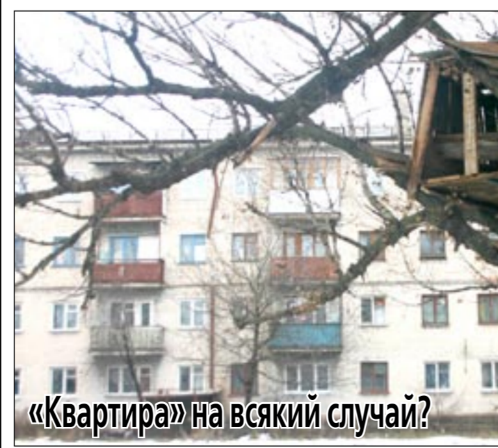
«Квартира» на всякий случай?

ДЭЗ-потрошитель И дождь вроде был небольшой, но, наверное, стал он по-