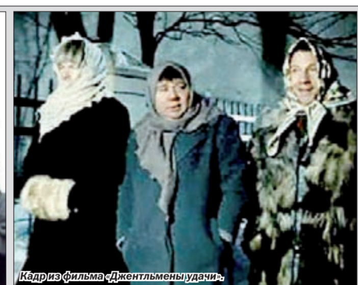
Кадр из фильма «Джентльмены удачи».