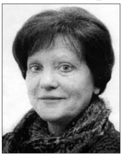
Ненаглядная дышит на ладан В обезлюдевших хуторах...