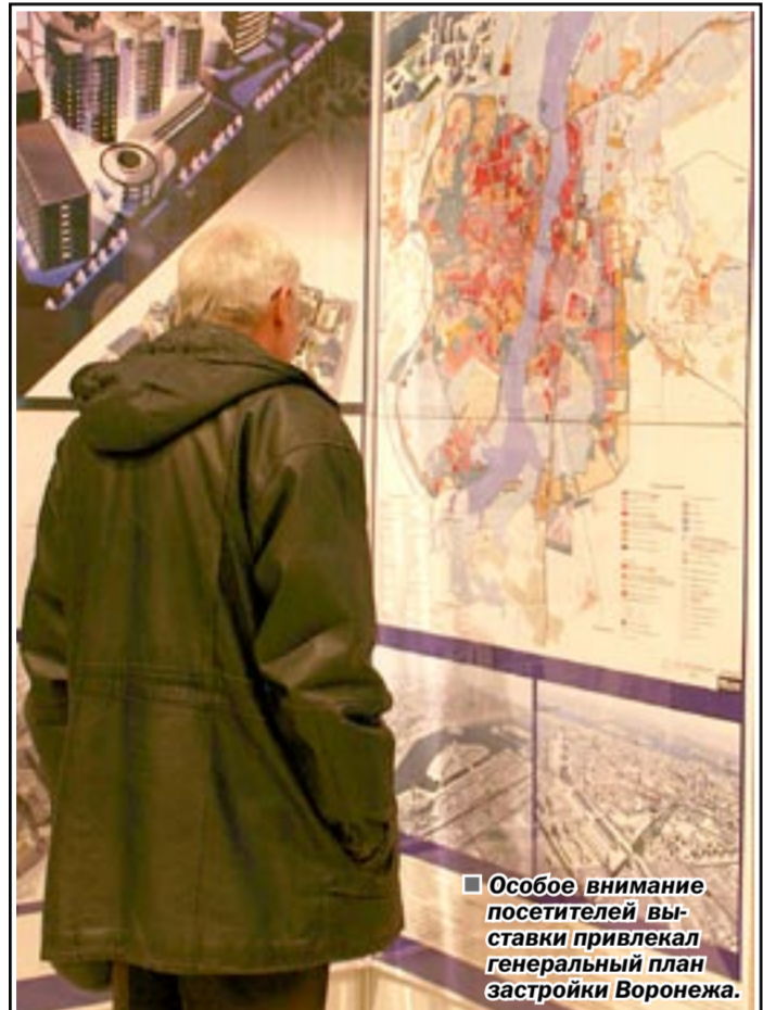
Особое внимание посетителей выставки привлекал генеральный план застройки Воронежа.

Комментарии со стороны грузинских властей и правоохранительных органов, а также представителей миротворческих сил в Абхазии пока не поступали.